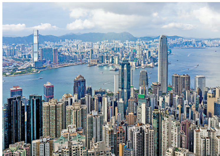
▲香港一景。

歲歲「七一」，這條鑄刻在心底的V字路徑永遠不會模糊。無論我身在何方，都會循着當年走過的路，遙望維港，把最真誠的祝福，送給我生活過、熱愛過的東方之珠——願這道昂揚的V形軌跡一直向前延伸，願香港煙火永續，安穩繁榮，歲歲風華，步步皆新。