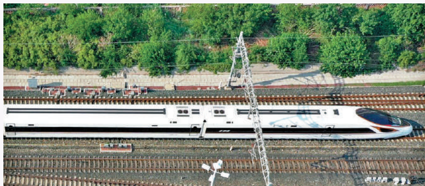
▼京津城際鐵路是中國首條設計時速350公里的高鐵，於2008年8月1日開通運營。

在農村改革方面，中央明確現有土地承包關係保持穩定並長久不變。2008年十七屆三中全會強調農業是安天下、穩民心的戰略產業，要求堅決守住18億畝耕地紅線，促進城鄉經濟社會發展一體化。此後中央加大農業財政投入，增加良種、農機具等補貼，充分調動種糧積極性。2011年糧食產量達5.7億噸，連續8年增長，農民收入連年提高。