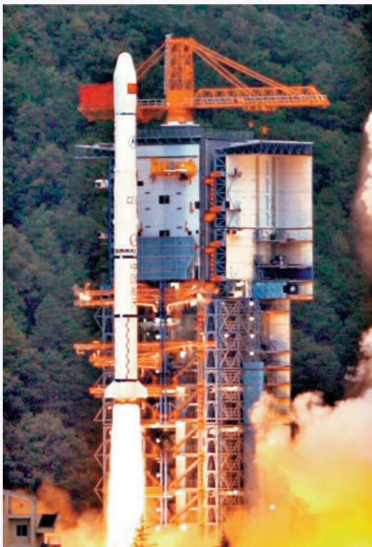
▲二〇〇七年十月二十四日，嫦娥一號探月衛星搭乘長征三號甲運載火箭成功發射。

在所有制改革方面，國有經濟戰略性調整和大型企業改革加快推進。到2011年，國資委監管的央企從2007年的159家減至117家，其中超80%資產集中在石油、電力、通訊等關鍵領域及運輸、冶金等支柱行業，整體素質和競爭力增強。同時堅持「兩個毫不動搖」，2010年國務院發文鼓勵引導民間投資健康發展，非公有制經濟發展環境進一步改善。