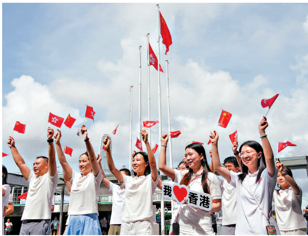
▲大批市民在尖沙咀碼頭揮舞國旗及區旗，慶祝中國共產黨成立105周年與香港回歸祖國29周年。