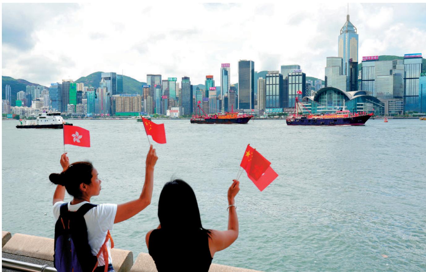
▲漁民團體昨日舉辦海上巡遊，慶祝香港回歸29周年。