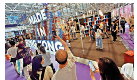
▲在深圳舉行的第二十一屆中國（深圳）國際文化產業博覽交易會上，香港館人頭攢動。

以CEPA為核心框架，內地與香港後續陸續簽署多項補充協議，持續擴大貨物貿易、服務貿易領域開放，不斷提升經貿合作水平。針對香港本地原材料資源有限的特點，自2012年起，港產產品生產中使用的內地原材料可視為香港原產料件，此舉既降低了港產產品的享惠門檻，也進一步推動兩地產業鏈供應鏈深度融合。