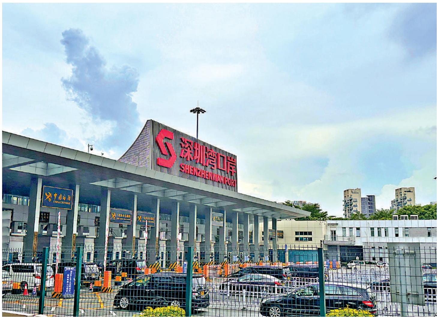
▲7月1日起，深圳灣口岸正式面向跨境司機推出「刷臉」智能通關便利措施。圖為車輛排隊通過深圳灣口岸。