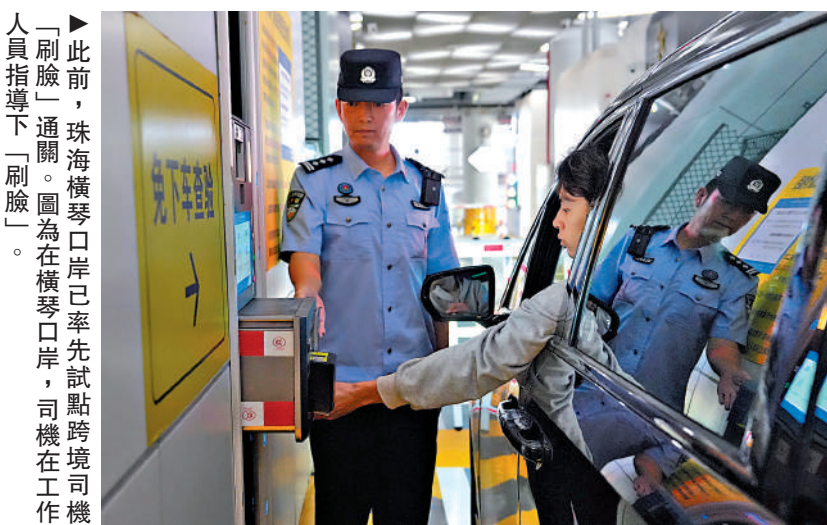
「刷臉」通關。圖為在橫琴口岸，司機在工作人員指導下「刷臉」。