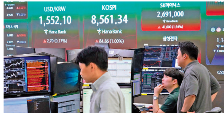
不少韓國父母會將子女教育基金投入到高波動股票，期望能為後代賺下身家。

2017-2018年間，韓國是全球加密交易最熱的市場，沒有之一。比特幣在韓國本土交易所（如Upbit、Bithumb）的溢價常年維持在10%-50%，這就是幣圈著名的「泡菜溢價」（Kimchi Premium）。螞蟻軍團為參與炒幣，透支信用卡、借高利貸，交易額一度佔到全球40%以上。2018年幣價崩盤後，