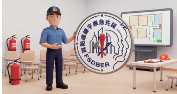
消防處今年三月推出「樓宇應急先鋒」計劃，為樓宇持份者提供消防安全及應急準備的資訊與訓練。

樓宇消防安全有賴政府部門、物業管理（物管）業界、業主立案法團及居民共同參與。消防處為提升社區的消防安全意識及應急能力，今年三月正式推出「樓宇應急先鋒」計劃，計劃由香港賽馬會慈善信託基金捐助，為相關持份者提供系統性的資訊與訓練，至今累計超過12,000人完成培訓。有見各界積極參與，消防處已將訓練恆常化，招募對象由物管從業員逐步推廣至業主立案法團成員及一般市民，以擴大防火網絡，共建安全社區。