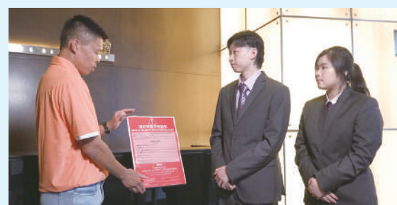
消防處代表向物管人員講解消防裝置失效通告的內容及張貼要求。