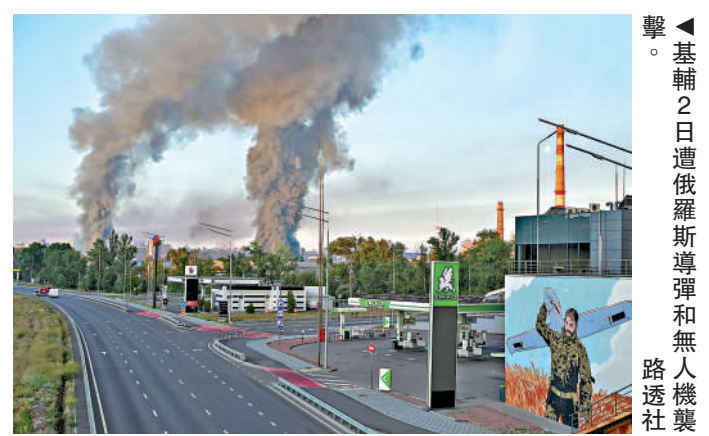
▲基輔2日遭俄羅斯導彈和無人機襲擊。

另據烏克蘭媒體1日報道，烏克蘭駐英國大使、烏軍前總司令扎盧日內近期在基輔與澤連斯基會面。扎盧日內當面告訴澤連斯基，如果烏克蘭在今年秋季舉行大選，他準備競選總統。扎盧日內被視為澤連斯基的有力競爭對手，但目前俄烏仍在激烈交火，烏克蘭何時有條件舉行大選仍是未知數。