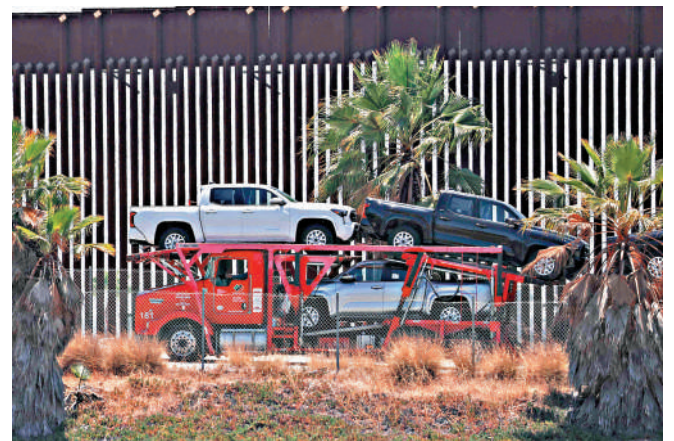
▲特朗普政府拒續簽美墨加協定，影響北美汽車行業。