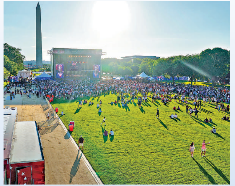
▲6月24日，特朗普主持的美國州博覽會開幕式觀眾不多，後方出現大片空地。特朗普為此惱羞成怒。