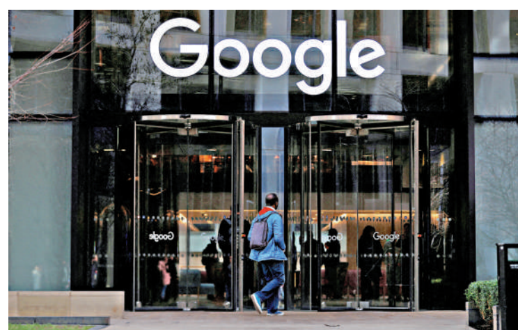
▲谷歌位於英國倫敦的辦公室。

2018年，歐盟委員會認定谷歌濫用Android系統的市場主導地位，通過與智能手機製造商簽訂協議，要求裝置預先安裝谷歌搜索、Chrome瀏覽器 etc 應用程序，藉此排擠競爭對手、鞏固市場