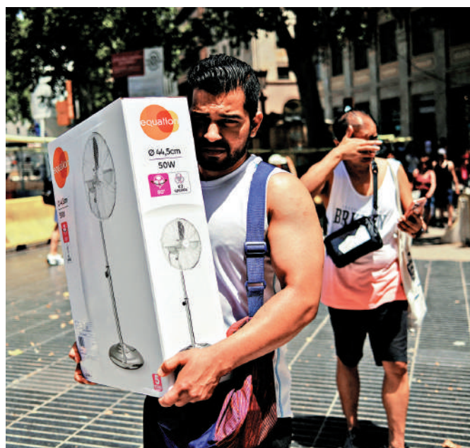
▲熱浪席捲西班牙，巴塞羅那一男子6月21日購入電風扇。

【大公報訊】綜合法新社、路透社報道：極端高溫近日襲擊歐洲，西班牙6月錄得異常酷熱天氣，該國6月有1028人因高溫死亡，是自2015年有記錄以來高溫相關死亡人數最多的月份。