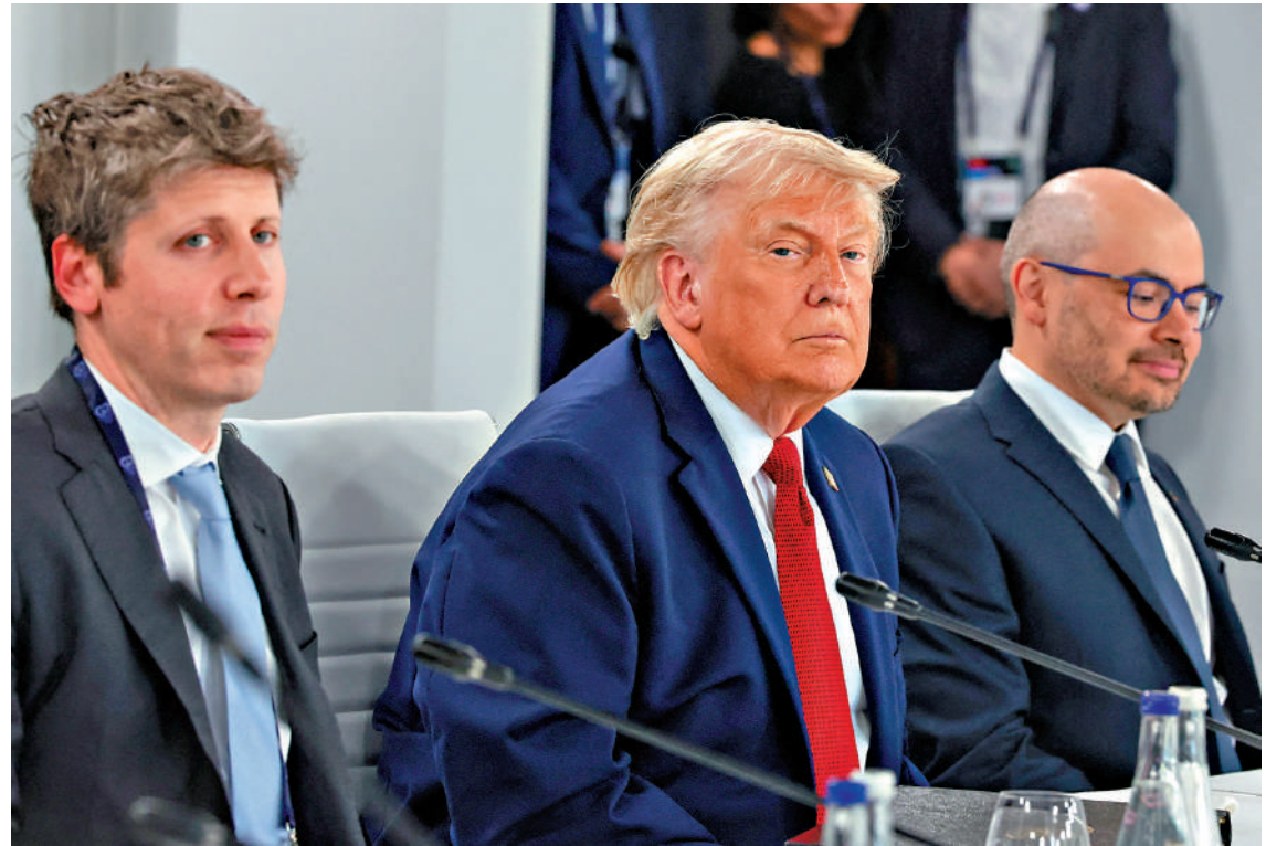
▲6月17日法國G7峰會，美國總統特朗普（左二）、OpenAI行政總裁阿爾特曼（左一）和谷歌DeepMind行政總裁哈里斯出席有關AI的工作會議。

《華爾街日報》指出，隨著AI技術迅速擴張，前沿模型成為新的政治戰場。OpenAI此舉的背後考量非常明確：將特朗普政府拉入自己的陣營，建立政府與AI企業的利益共同體。對OpenAI而言，上市是生死攸關的硬仗，最大障礙正是美國當局近期收緊的AI審查機制。OpenAI拋出5%股權的橄欖枝，究竟能否成功為AI產業買下「政治保險」，換取順利上市的通行證，成為今年硅谷與華盛頓角力的最大看點。（綜合報道）