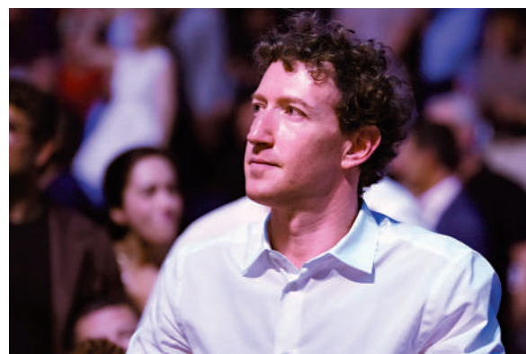
▲6月14日，Meta創辦人朱克伯格出席在白宮南草坪舉行的美國終極格鬥冠軍賽（UFC）。

報道稱，Meta近年來一直加速建設數據中心及其他AI基礎設施，以推動人工智能發展，預計今年在AI基礎設施的支出將高達1450億美元。彭博社1日報道，Meta期望通過向外部客戶出售過剩算力來實現收入增長。知情人士透露，其中一個方案是向客戶開放部署在Meta現有AI基礎架構上的多種AI模