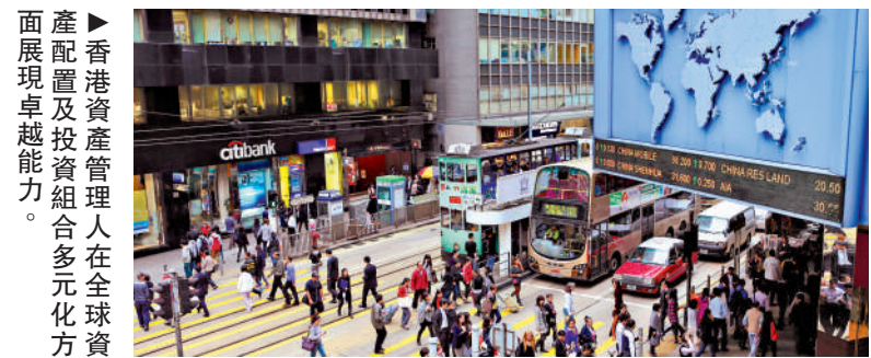
香港資產管理人在全球資產配置及投資組合多元化方面展現卓越能力。

證監會投資產品部執行董事吳家剛則指出，香港於2025年充分展現在全球挑戰下的強勁韌性及日益增強的影響力，有賴全球投資者的堅定信心、市場蓬勃的創新發展及世界級人才庫。未來證監會將繼續致力優化監管措施，以提升香港作為頂級國際金融中心及領先離岸人民幣樞紐的競爭力。