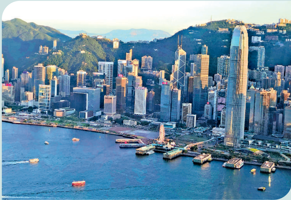
全球長期資本加速湧入，帶動香港管理資產規模及資金流入雙雙錄得強勁增長。