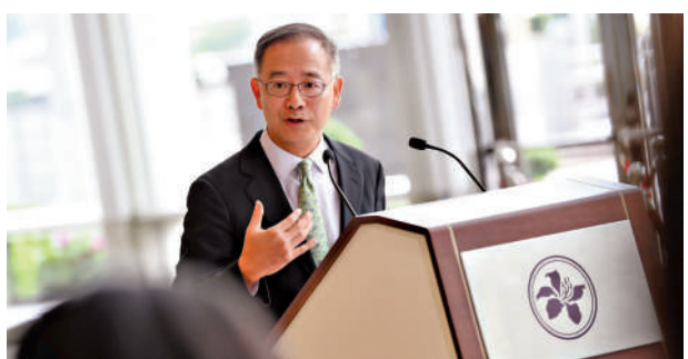
▲余偉文表示，當局正積極與區內其他中央銀行機構探討與印尼盾直接兌換問題。

余偉文又預告，金管局將與香港證監會、香港交易所、債券通公司等，於7月7日（下周二）聯合舉辦香港固定收益及貨幣峰會暨債券通論壇，匯聚政策制定者、監管機構及金融領袖，共同探討香港固定收益及貨幣市場以及中國債券市場的機遇和未來發展。