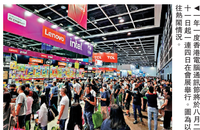
▲一年一度香港電腦通訊節將於8月十一日起一連四日在會展舉行。圖為以往熱鬧情況。