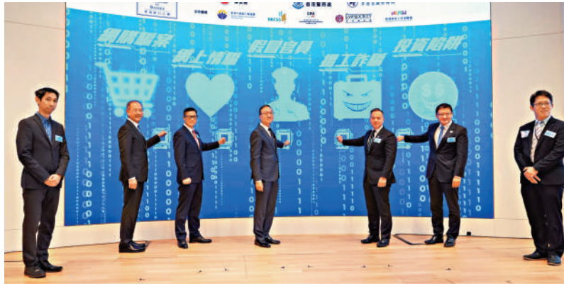
▲銀行公會「全民防騙教育工作啟動禮」昨日舉行，律政司司長林定國、保安局局長鄧炳強及警務處處長周一鳴等出席。

【大公報訊】香港銀行公會昨日舉行「2026全民防騙教育工作啟動禮」，冀透過跨界別協作，提升市民對各類騙案的警覺及辨識能力。