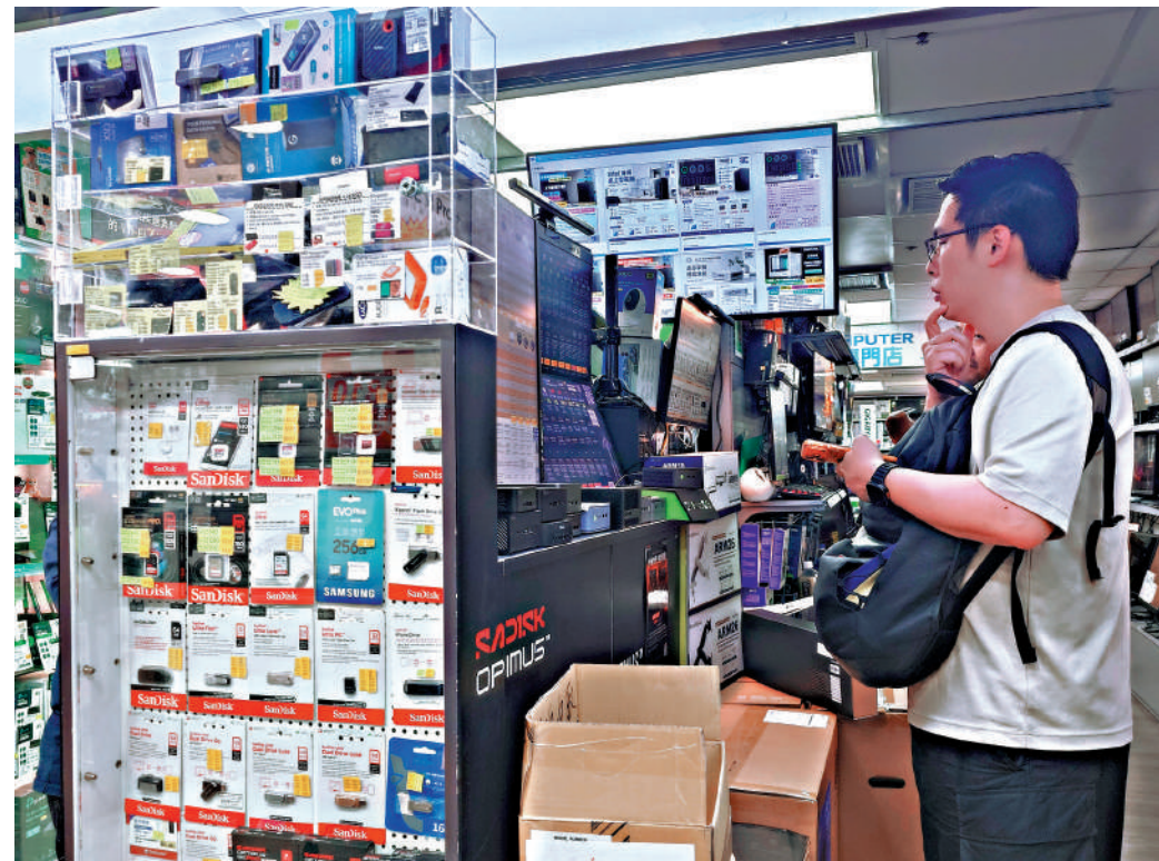
▲近期本港電腦產品售價急升，有市民表示，選購產品時都會多作考慮，或延遲購買。