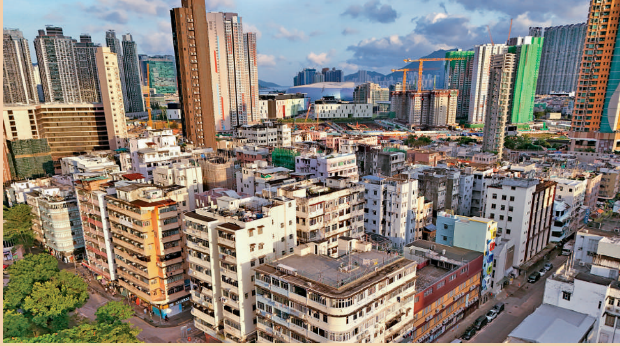
▲政府早前於四區推行「聯廈聯管」試驗計劃。