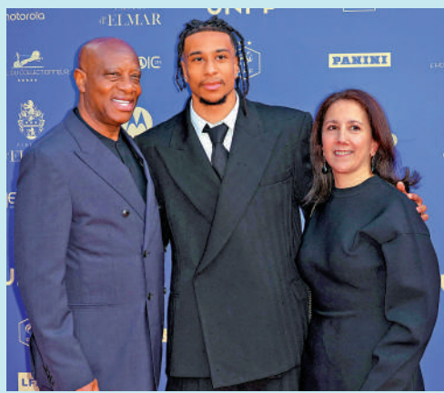
◀奧利斯（中）與父母合照。

茵場上用傳球與助攻來說話。正是這種專注於足球本身的沉靜心態，讓他在高壓的世界盃淘汰賽階段依然能保持冷靜頭腦，一次次精準地為隊友送出致命的傳球。