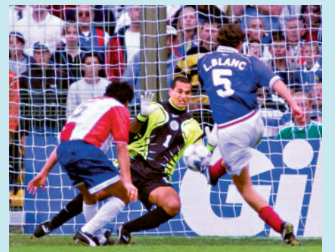
▲白蘭斯（右）在1998年攻破巴拉圭大門。資料圖片

世界盃歷史上首個「黃金入球」，正是誕生於法國隊與巴拉圭隊的對決之中。1998年6月28日，這場世界盃16強戰在法國上演，主辦國法國隊在核心施丹停賽缺陣的情況下，遭遇由門將艾拉華特領軍的巴拉圭隊頑強抵抗，雙方在90分鐘戰成0：0平手，要進入加時賽分勝負。加時114分鐘，法國中堅白蘭斯挺身而出，攻入致勝「黃金入球」，協助法國隊以1：0立即淘汰對手，晉身8強。這一歷史性時刻，也成為永不磨滅的經典畫面。