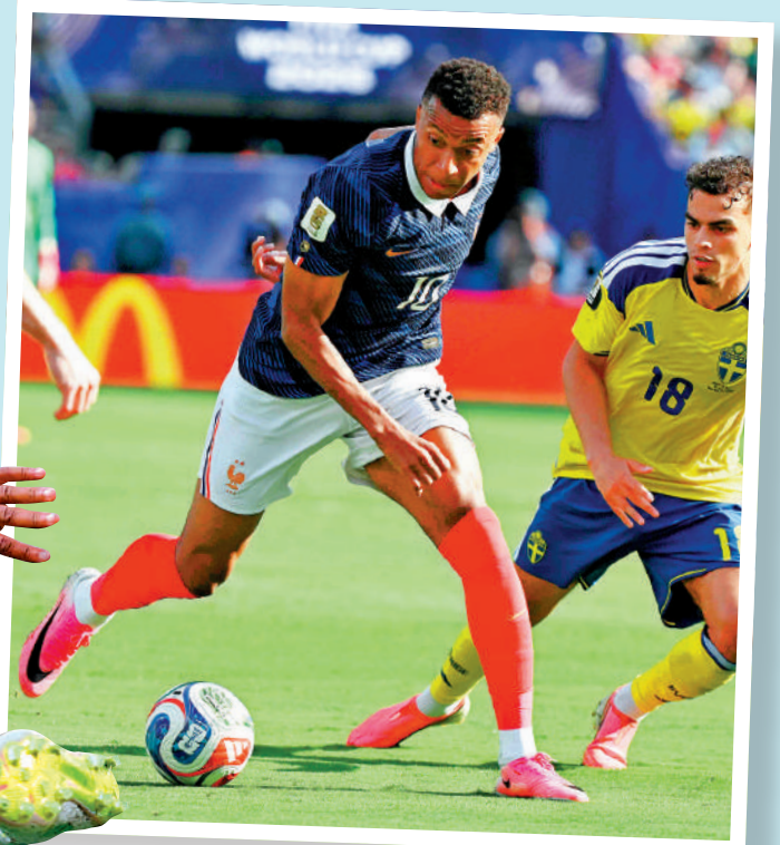
▲法國前鋒麥巴比（左）。