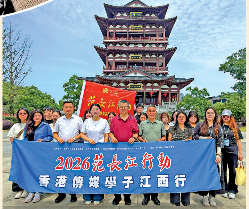
▶6月26日，「2026范長江行動——香港傳媒學子江西行」一行到訪江西省九江市彭澤縣，參觀五柳書院與狄公樓。圖為採訪團在狄公樓前合影。