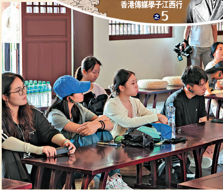
▲贛港傳媒學子在五柳書院坐蒲團體驗書生生活。