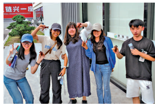
▲傳媒學子們手持鮮活小龍蝦合影。