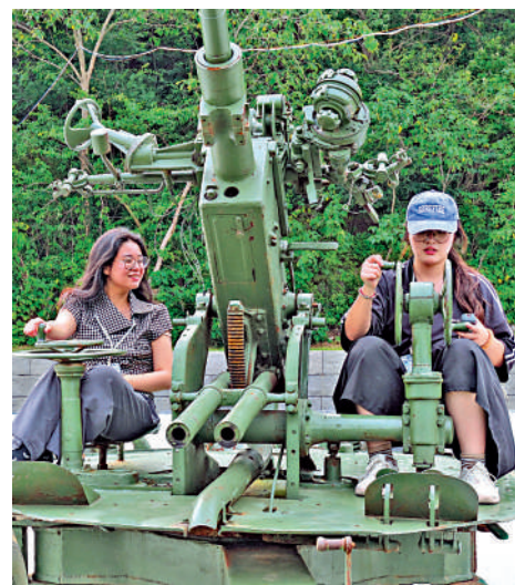
▲贛港傳媒學子與炮台模型合影。

如今，作為全國重點文物保護單位的馬當礮臺，已於2020年成功入選國家級抗戰紀念設施、遺址名錄，持續向後人訴說着那段不屈的民族記憶。