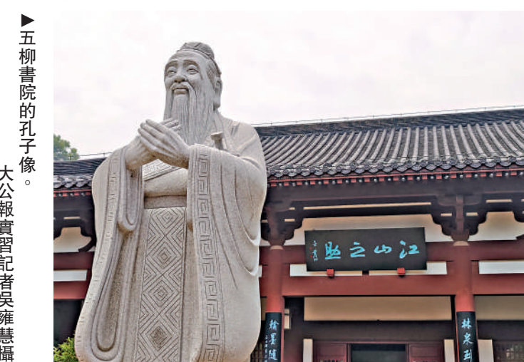
▶五柳書院的孔子像。