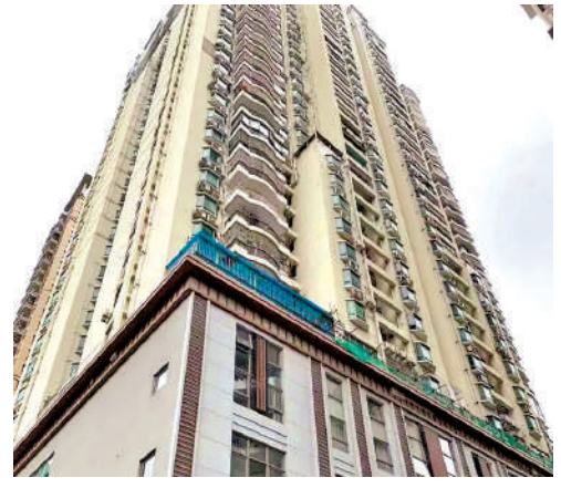
▲紫光名苑為單幢塔樓設計住宅。

新皇崗口岸最引人注目的變化是通關效率飛躍，5分鐘通關和24小時全天候運作，意味着深港跨境商務通關將變得如同市內通勤一樣便捷，極大地降低了企業的時間與物流成本，為深港「雙城生活」與「一小時經濟圈」注入了強大動力。