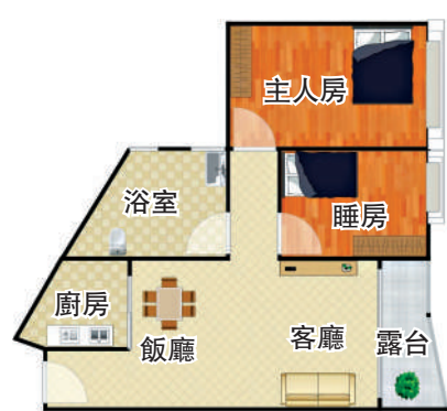
▲港田華園58平方米兩房兩廳戶型圖。

教育配套方面，周邊分布有金地名津幼兒園、福民小學、皇崗創新實驗學校、深圳福田第二實驗學校（南校區）等學校。