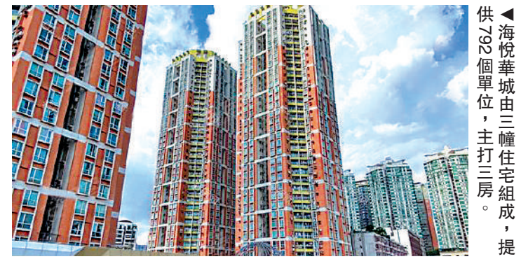
▲海悅華城由三幢住宅組成，提供26個單位，主打三房。