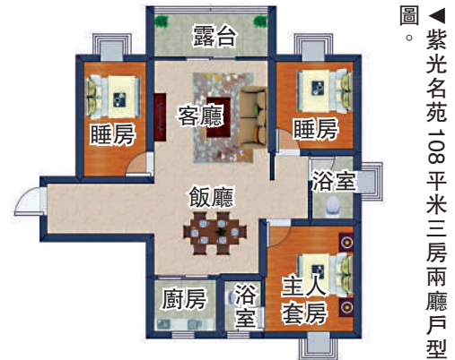
▲紫光名苑108平方米三房兩廳戶型圖。