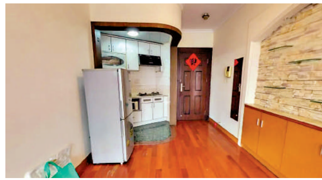
▲港田華園戶型方正實用，主力為兩房至三房戶。