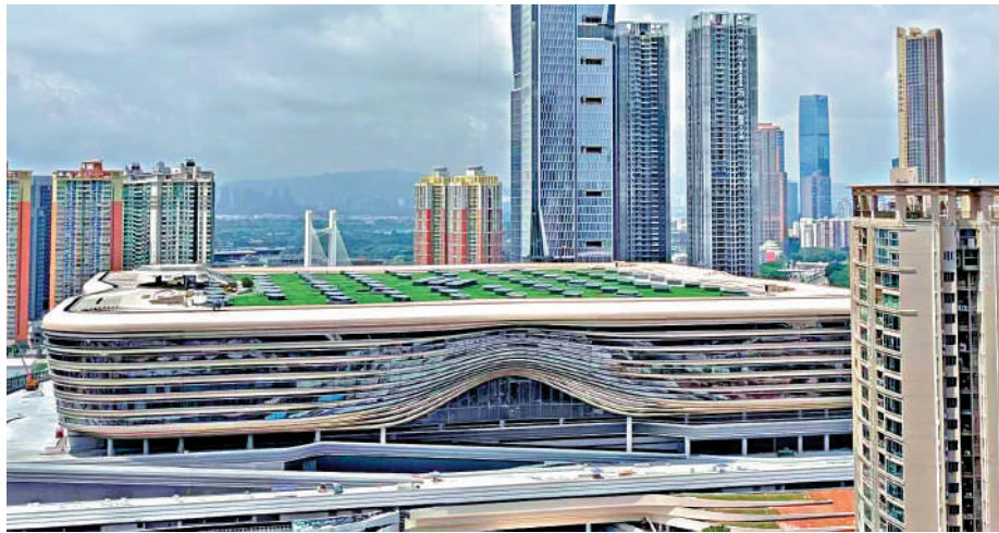
▲新皇崗口岸快將開通啟用，周邊樓市熱度有望進一步升溫。