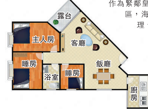
▲海悅華城79平方米三房兩廳戶型圖。

作為緊鄰皇崗口岸的高綠化社區，海悅華城憑藉港式管理、通透戶型和無可替代的深港交通便利，持續吸引着深港兩地置業者關注。