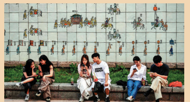
▲首爾民眾在清溪川畔休息。

不過，韓國近期科技股出現劇烈波動、多次觸發股市熔断，這場全民炒股的「造富神話」，是否一場即將在高位引爆的金融泡沫，目前仍充滿懸念。