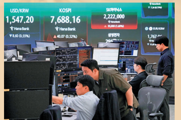
▲7月3日，韓亞銀行的外匯交易員在外匯交易室關注股市。