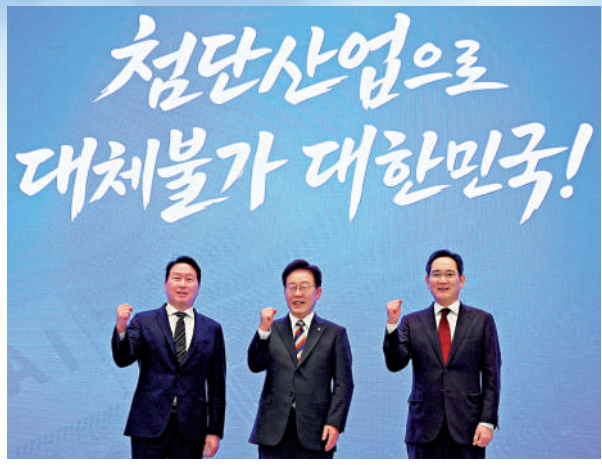
▲6月29日，韓國總統李在明（中）與三星電子董事長李在鎔（右）和SK集團董事長崔泰源出席AI產業園發布會。

受益於半導體巨頭三星電子和SK海力士業績暴漲，今年韓國經濟數據亮眼，被形容為人工智能（AI）紅利。但繁榮背後暗藏產業結構失衡、貧富分化加劇的危機：經濟增長高度依賴半導體，貧富差距創六年新高。普通民眾感嘆民生壓力不斷增加，工作越來越難找，所謂的「AI紅利」只是「紙上富貴」。