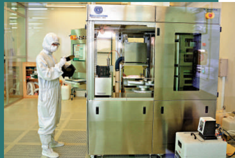
▲韓國高麗大學半導體工程專業的學生正在操作機器。

不過，部分專家對此抱懷疑態度。現代工業研究院經濟學家朱元（音譯）表示，半導體製造是一項資本密集型產業，而非勞動密集型產業，根本無法創造大量就業崗位。韓國政府數據顯示，半導體製造業佔韓國總勞動力的不到1%。2023年至2025年韓國半導體出口增長75%，但該行業僅新增1000個就業崗位。