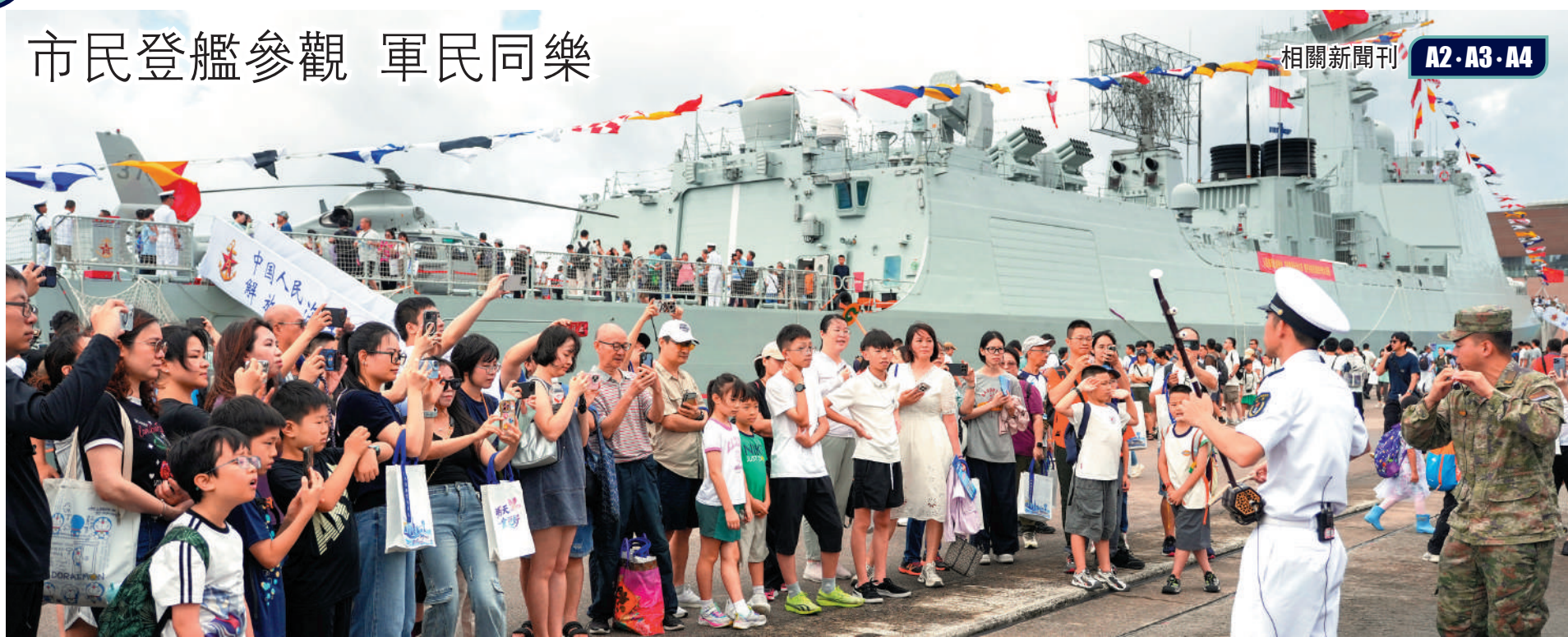
▲解放軍導彈驅逐艦南寧艦、導彈護衛艦衡陽艦組成的海軍艦艇編隊昨日在昂船洲軍營舉行首個公眾開放日。軍樂團演奏樂曲，為活動注入愛國強音。