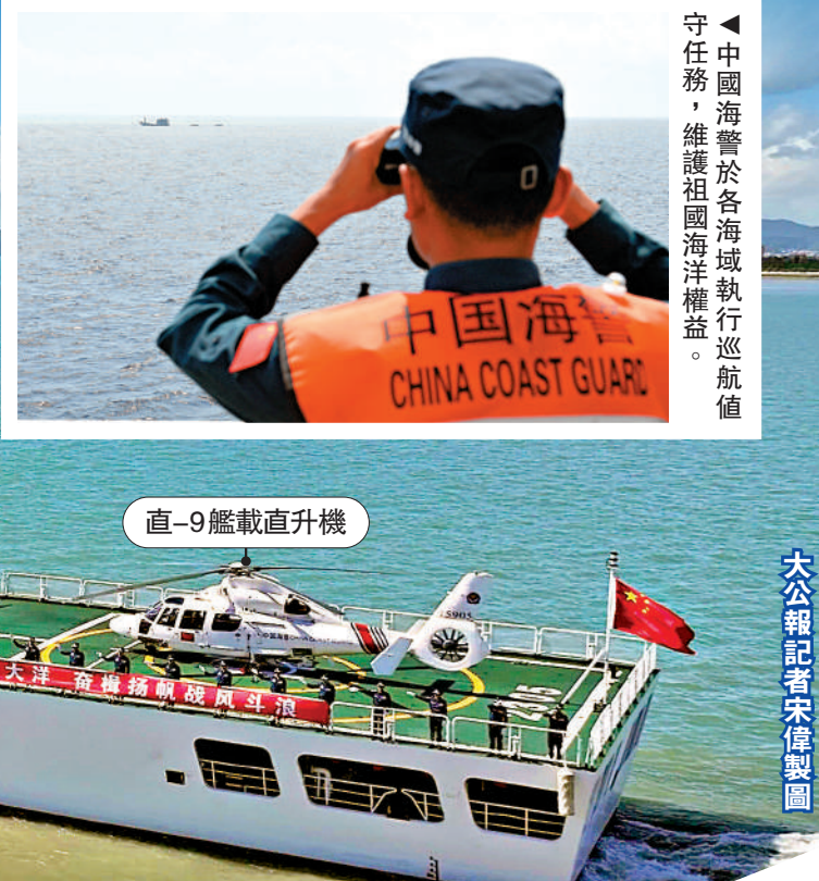
▲中國海警於各海域執行巡航任務，維護祖國海洋權益。