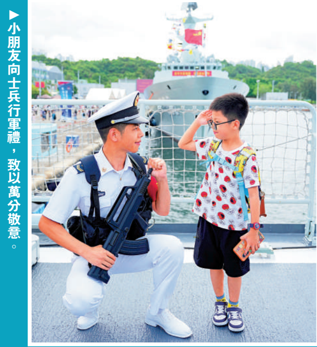
▲小朋友向士兵行軍禮，致以萬分敬意。