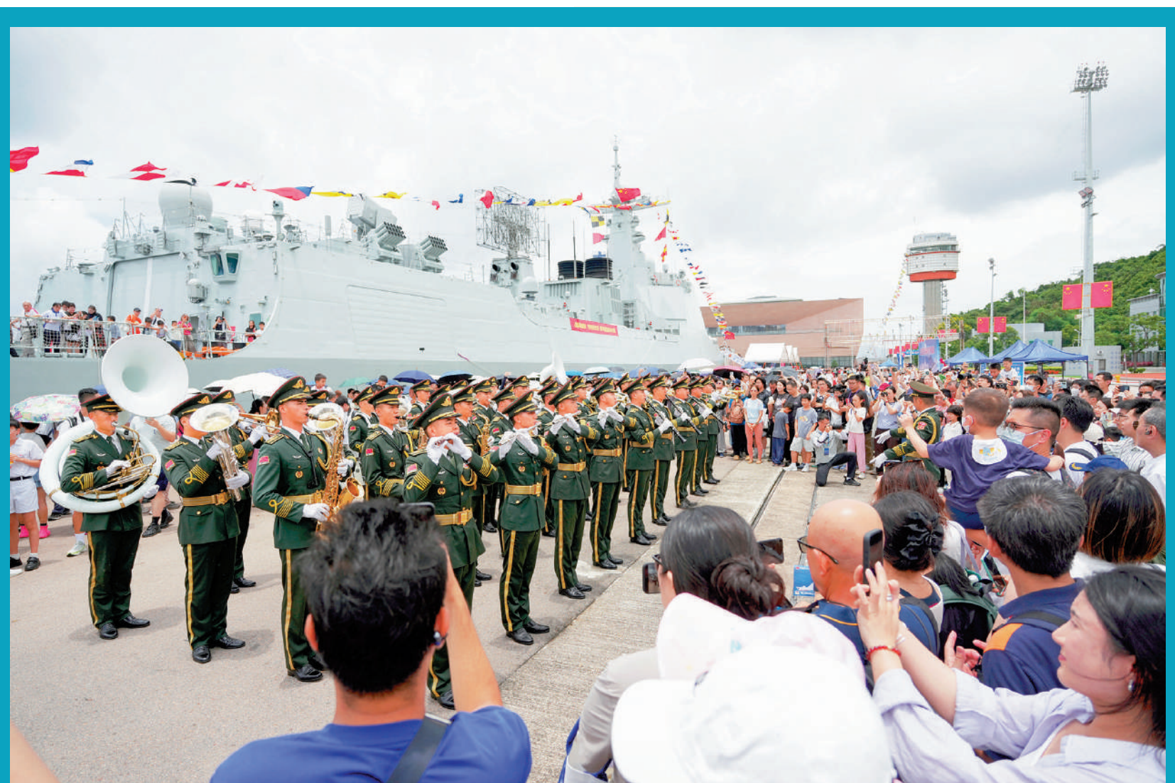
▲軍樂團演奏鏗鏘昂揚的樂曲，市民掌聲與歡呼聲不斷。