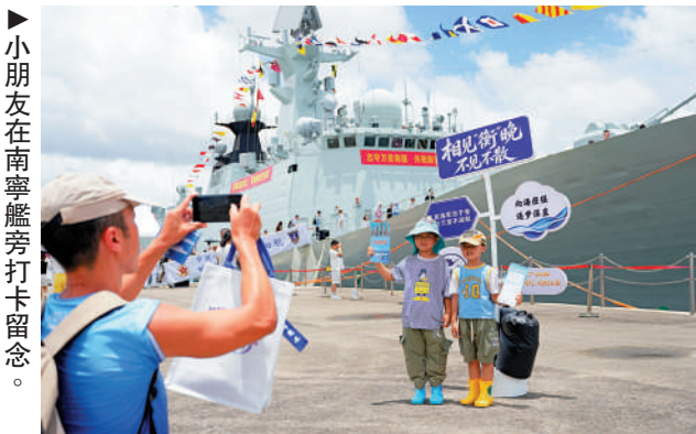
▲小朋友在南寧艦旁打卡留念。