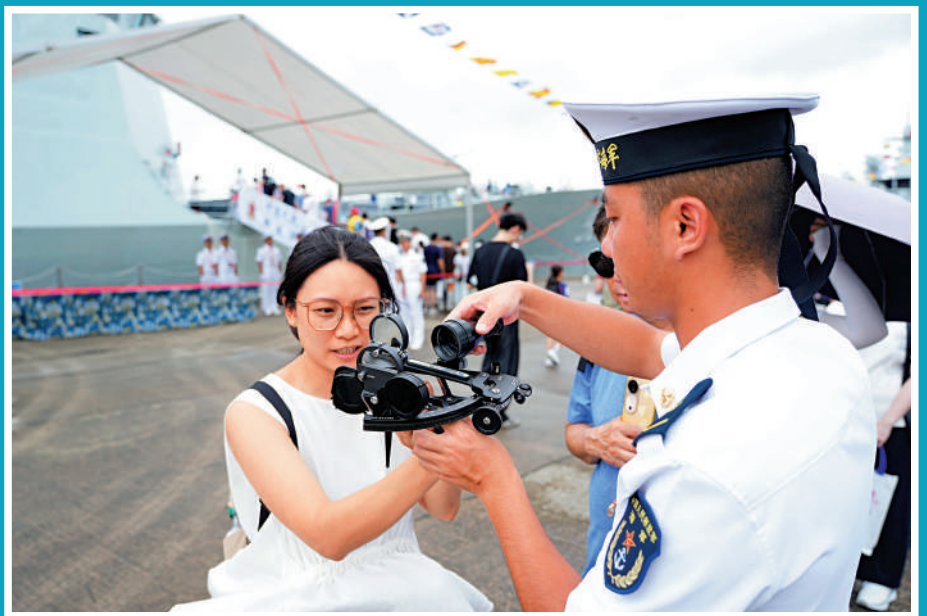
▲市民在攤位試操作航海儀器甚感吃力，官兵從旁指導。