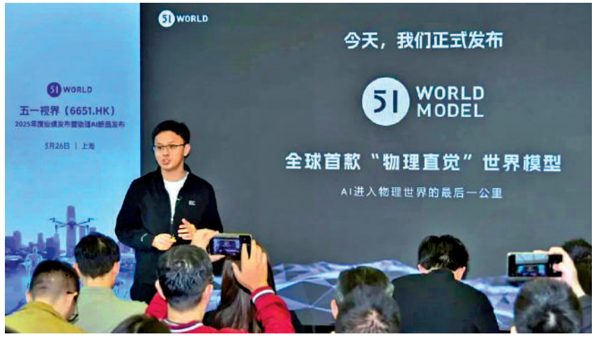
▲科企五一視界是近來落戶前海深港匯總部基地的企業之一。

曾幾何時，內地企業走向海外多為「單打獨鬥」，「借港出海」不乏「頭破血流」者。為了聯動香港，助力企業打造加速創新、拓展海外市場的最好平台，前海管理局會同香港引進重點企業辦公室（OASES，簡稱香港引進辦）等機構共同打造了深港雙向總部基地——「深港匯」。