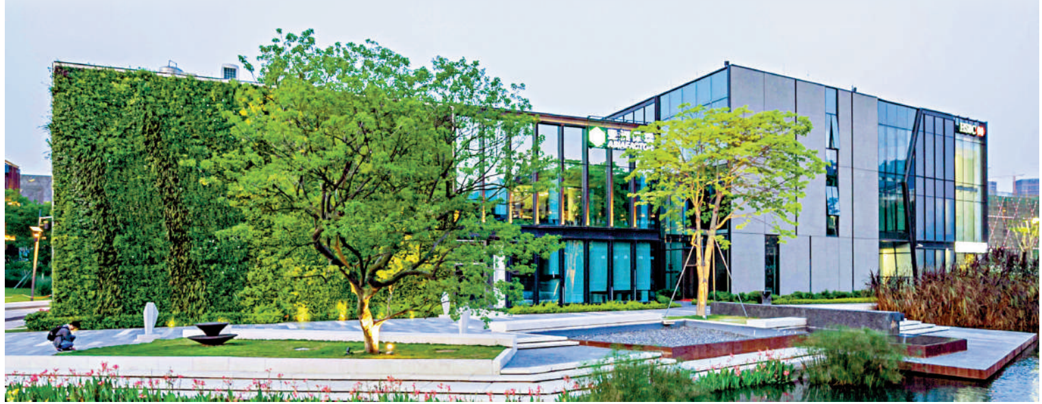
▲位於深圳前海的深港匯總部基地助力要素跨境流動，目前該平台已引進13家總部科企。圖為深港匯園區綠地布局錯落有致，環境清幽。