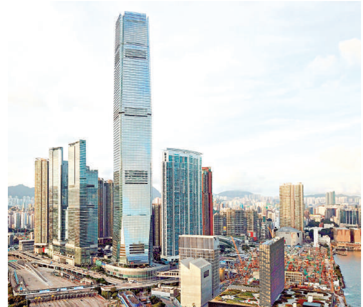
▲香港去年管理財富資產42.2萬億元，若換成1000元鈔票疊起，高度相當於8700座環球貿易廣場（圖中最高建築）。