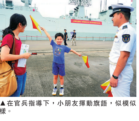
▲在官兵指導下，小朋友揮動旗幟，似模似樣。