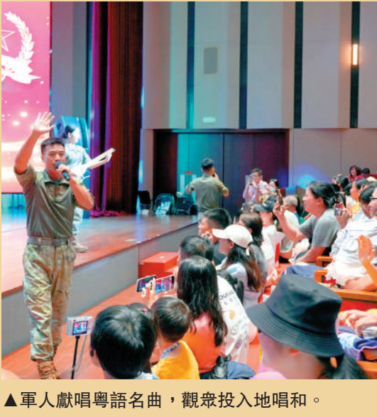
▲軍人獻唱粵語名曲，觀眾投入地唱和。