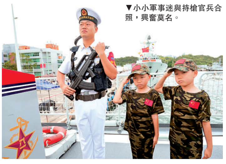
▼小小軍事迷與持槍官兵合照，興奮莫名。