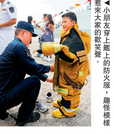
▲小朋友穿上艦上的防火服，趣怪模樣惹來大家的歡笑聲。