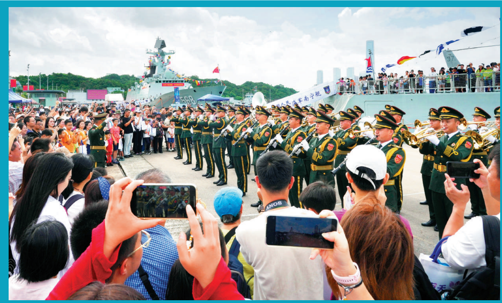
▲南寧艦前方昨日有軍樂團表演，樂聲雄壯，當演奏《歌唱祖國》一曲，大家都齊聲合唱。