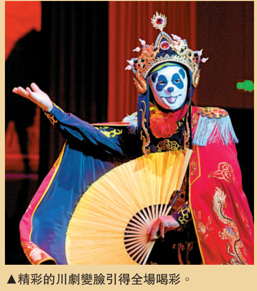
▲精彩的川劇變臉引得全場喝彩。