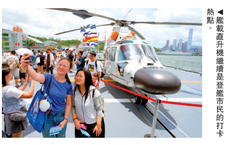
▲艦載直升機繼續是登艦市民的打卡熱點。

由導彈驅逐艦南寧艦、導彈護衛艦衡陽艦組成的海軍艦艇編隊今日（6日）圓滿完成在香港的系列開放參觀和文化交流活動，料上午經鯉魚門離港。市民若送別軍艦，不要錯過最後機會。