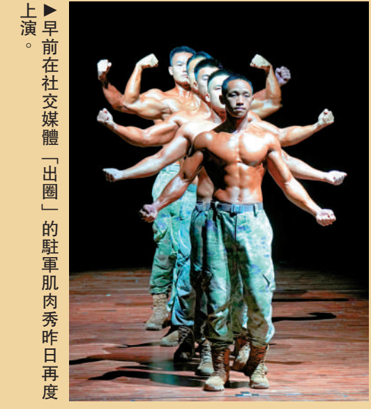
▲早前在社交媒體「出圈」的駐軍肌肉秀昨日再度上演。