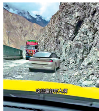
▲進藏路途山高路險，出發前必須提前檢查車輛車況。

長線出行類網紅內容長久以來的行業弊病。多地早前出現超長距離出租車長途拍攝案列，事後接連爆出車隊劇本綵排、營運流程不符合出租車管理條例等問題。此次兩千多公里高原營運路線，路段環境複雜，常規城市出租車輛並未適應高原長途行駛標準，潛藏不容忽視的行程安全隱患。短視頻着重渲染自由奔馳遠方的情緒價值，容易誤導年輕群體盲目效仿冒險式出行。