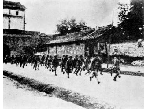
▲駐守宛平城的中國軍隊出城抗擊日本侵略軍。