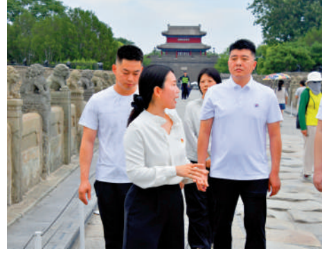
▲7月6日，義務講解員在盧溝橋上為青年人講解中國人民抗日戰爭的歷史。

7月8日，「七七事變」後第二天，中共中央發出通電：「全中國的同胞們！平津危急！華北危急！中華民族危急！只有全民族實行抗戰，才是我們的出路！」中國守軍奮起進行的七七抗戰，開啟中國人民偉大的全民族抗日戰爭。