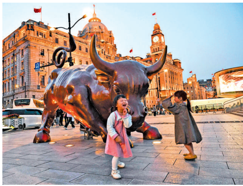
▲海外機構投資者逐漸將人民幣納入投資組合，其中超過五成透過滬深港通進行投資。

受訪者分別來自澳洲、印度、印尼、日本、馬來西亞、新西蘭、菲律賓、新加坡、泰國、中國內地、中國香港及中國台灣等12個市場，其中包括銀行、資產管理公司、對沖基金、保險公司、證券公司、保薦機構及公營機構。