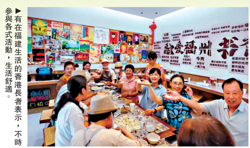
▶有在福建生活的香港長者表示,不時參與各式活動,生活舒適。