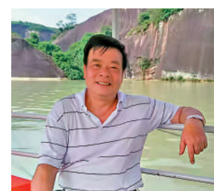
▲文叔期待早日開立指定賬戶,以免除跨境取款手續費。