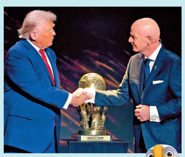
▲特朗普（左）去年獲FIFA頒發和平獎。右是FIFA主席恩芬天奴。資料圖片