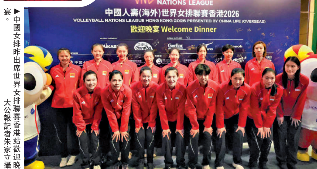
中國女排昨出席世界盃香港站歡迎晚宴。