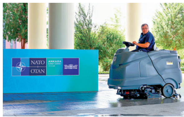
在土耳其安卡拉舉行的北約峰會開幕前，工作人員6日在會場清掃地面。

特朗普在第一個總統任期內就因歐洲國防務開支佔比「不達標」等事項對北約心存不滿，2025年重返白宮以來對歐洲盟友愈加「冷眼相待」：對歐盟輪美產品加徵關稅，毫不掩飾對丹麥自治領地格陵蘭島的覬覦，指責北約在美國對伊朗作戰期間「作壁上觀」，宣布從德國撤出數千名美軍，以及考慮停售「戰斧」巡航