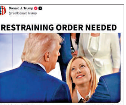
▲特朗普5日在社媒發布照片，畫面中意大利總理梅洛尼仰頭望著特朗普。

自今年2月28日美國與以色列對伊朗發動大規模襲擊以來，特朗普多次批評意大利等歐洲盟友拒絕美軍使用境內軍事基地及領空，實施打擊伊朗的行動。分析認為，特朗普近期發布的挑釁帖文，標誌著美意分歧從政策層面進一步滑向個人化、公開化的羞辱戰。