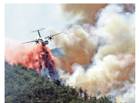
▲法國東比利牛斯省山火肆虐，一架消防飛機6日在火場上方倒水滅火。

希臘北部城市塞薩洛尼基的山火已波及至少兩家工廠，產生有毒濃煙，當局呼籲居民緊閉門窗。