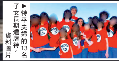
▶特平夫婦的13名子女長期遭虐待。 資料圖片

這6名受害者起訴了加州河濱縣政府和負責將他們安置在寄養家庭的私人寄養機構，指他們在寄養系統內遭受了「嚴重的虐待和忽視」。2024年，奧爾金一家承認犯有危害兒童罪和非法監禁罪。馬塞利諾·奧爾金被判7年監禁，其妻子和女兒被判4年緩刑。