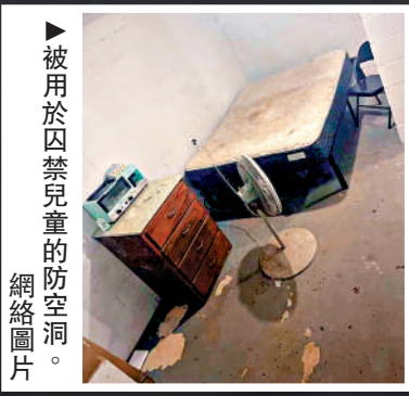
▶被用於囚禁兒童的防空洞。

2025年7月，亞拉巴馬州比伯縣一宗虐童案曝光。8名嫌疑人被指控在地下防空洞裏非法拘禁兒童並對他們下藥、實施性虐待，受害者包括至少10名3至15歲兒童。該團夥拍攝兒童性虐待視頻並通過暗網出售，還收取費用，讓「顧客」進入防空洞虐待兒童。此案仍在審理中，美媒披露，部分嫌疑人是受害兒童的親生父母。