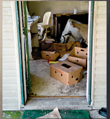
▶受害兒童居住環境極其髒亂。