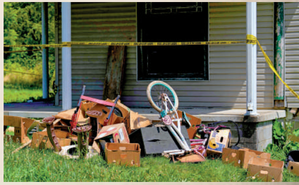
▲案發現場堆着許多垃圾和雜物。