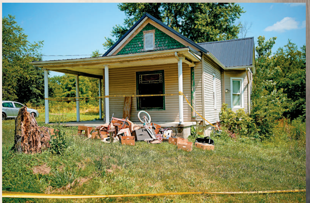
▲警方1日在俄亥俄州一棟房屋內發現16名遭嚴重虐待的兒童。

該團夥還將虐童發展成「產業」，拍攝虐童視頻並通過暗網出售，甚至讓「顧客」付費進入防空洞施虐。美媒披露，嫌疑人包括一些受害兒童的親生父母。