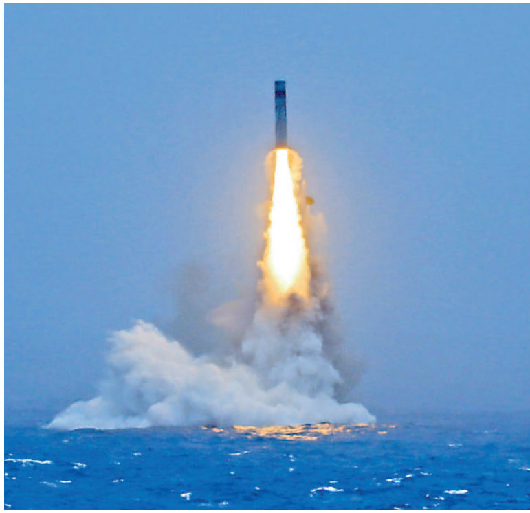
▲7月6日12時01分，中國海軍1艘戰略核潛艇成功發射1發攜載訓練模擬彈頭的潛射戰略導彈，準確落入預定海域。圖為導彈出水瞬間。

值得注意的是，潛射洲際導彈研發與發射難度極高，對導彈本體、核潛艇平台以及發射操作人員都有着嚴苛要求。導彈在水下發射階段需要承受巨大水壓與彈射衝擊力，出水後又要快速適應空氣阻力驟降的空中環境。這對彈體結構強度、外形設計、飛行姿態控制都提出極高標準，同時也要求導彈發動機、水下發射系統具備優異的耐高溫、抗衝擊性能。特別是在導彈外形設計方面要求苛刻，潛艇內部空間極其有限，導彈必須垂直布置，且長度必須嚴格適配潛艇耐壓殼直徑。這就要求導彈在保持大射程、大威力的前提下，實現極致的「矮