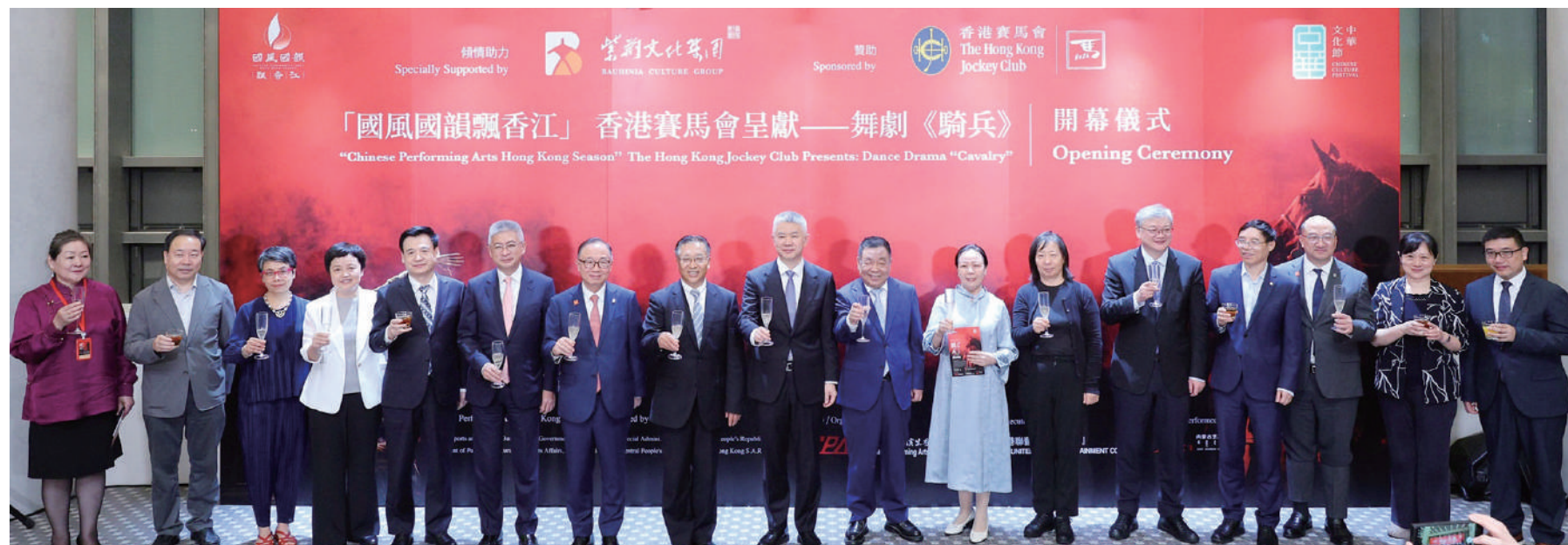
▲馬會主席廖長江(左七)及公司事務執行總監譚志源(右三)，聯同中央政府駐港聯絡辦副主任孫尚武(中)、中華人民共和國外交部駐香港特派員公署特派員崔建春(左八)、紫荊文化集團董事長許正中(右八)、香港特區政府文化體育及旅遊局副局長劉震(左六)、中央政府駐港維護國家安全公署一級二級巡視員宋一平(左五)、內蒙古藝術劇院院長李莉(右七)，以及一眾嘉賓出席「香港賽馬會呈獻——舞劇《騎兵》開幕儀式」。