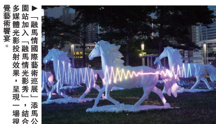
▲「融馬情國際藝術巡展」添馬公園站，透過光影投射效果，呈現一場結合多媒體藝術的藝術饗宴。