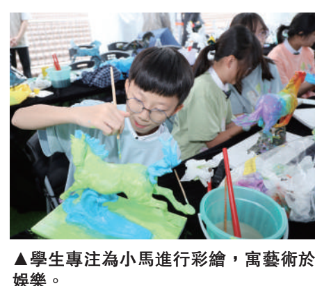
▲學生專注為小馬進行彩繪，寓藝術於娛樂。