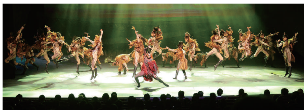
▲馬會呈獻的舞劇《騎兵》在東九文化中心劇院圓滿演出。

至於添馬公園站的展覽，除了由馬興文創作、兩匹分別超過三米高的融馬雕塑，另有多座社區馬匹雕塑，以及約50座由不同團體及公眾參與彩繪的小融馬同場展出。展覽在晚上時段更加入以馬為主題的光影投射燈光秀，呈現馬匹奔騰的動感與力量，弘揚人馬情誼，以及賽馬運動對香港社會的貢獻，與眾同樂，同時推動本地旅遊，並促進馬匹運動和體育發展。