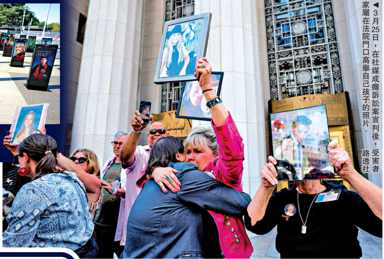
▲3月25日，在社媒成癮訴訟案宣判後，受害者家屬在法院門口高舉自己孩子的照片。

美國社交媒體巨頭Meta於6日提交的法庭文件顯示，包括加州在內的4個州向該公司追索1.4萬億美元（約合11萬億港元）的天價罰款，指控Meta刻意設計旗下Facebook和Instagram社交媒體致青少年上癮，並在安全方面誤導公眾。案件將於8月在加州奧克蘭市開庭審理。該索償金額接近Meta目前的市值，該公司否認相關指控。社交媒體對青少年的危害日益引發關注，包括Meta等在內的社媒巨頭在全美面臨數千宗相關訴訟，類似案件或陸續有來。