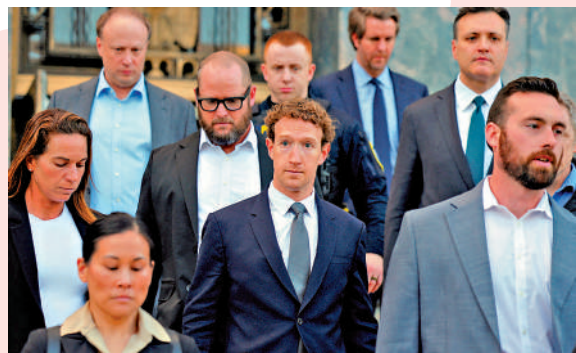
▲Meta創辦人朱克伯格（中）2月在社媒成癮案中作證後離開法庭。