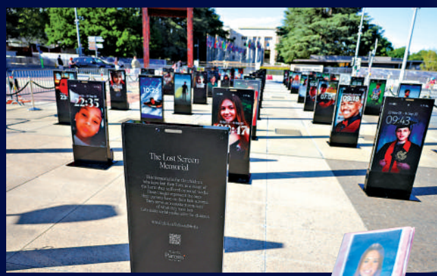
▲瑞士日內瓦5月豎立「失落屏幕」紀念碑，紀念因網絡暴力、霸凌等受害去世的兒童。