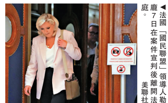
▲法國「國民聯盟」領導人勒龐7日在案件宣判後離開法庭。

不過民調顯示，現任國民聯盟主席巴爾代拉支持率已達35%至37%，在國民聯盟選民中，58%傾向選擇巴爾代拉而非勒龐作為候選人。