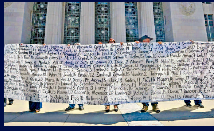
▼3月25日，家屬在洛杉磯高等法院拉橫幅展示受害者名字。