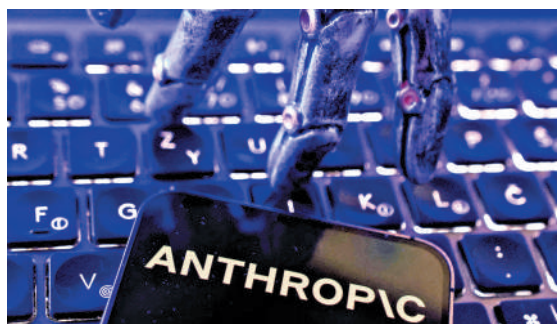
▲AI公司Anthropic開發的最新款AI模型Mythos近期飽受爭議。

列入黑名單期間，美國國家安全局（NSA）卻發現仍繼續使用Anthropic的最新Mythos模型，以進行網絡攻擊的相關行動。6月12日，特朗普政府以「國家安全」為由，要求Anthropic限制外國用戶訪問最新AI模型Fable 5及Mythos 5，該公司被迫把這兩款模型下架。經過交涉，Anthropic作出讓步，美國商務部於6月30日解除相關限制。