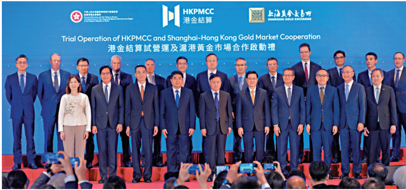
▲「港金結算試營運及滬港黃金市場合作啟動禮」昨日在香港固定收益及貨幣峰會暨債券通論壇期間舉行。

黃金交易生態圈是指將黃金從「實物開採精煉」、「大宗倉儲物流」、「現貨與期貨交易」、「中央清算結算」，到下游的「財富管理產品（如黃金ETF、強積金投資）」，全部整合在同一個安全、高效且受監管的金融與實業產業鏈。香港打造的黃金交易生態圈，充分發揮自由港、低稅率及法治等多項優勢，建立一個「實物與金融相結合」的全球黃金樞紐。