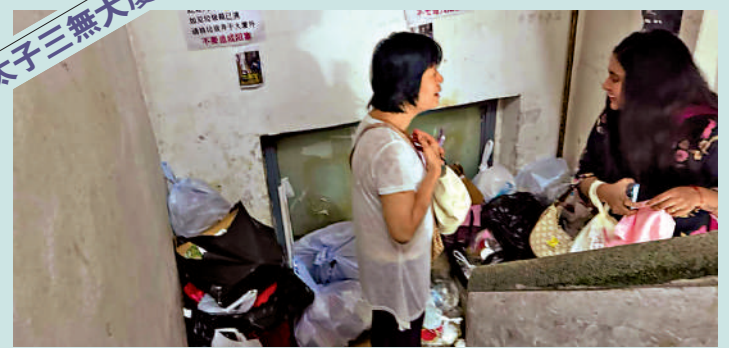
▲一名業主與南亞裔租客就處理垃圾棄置問題發生爭執，最終租戶將垃圾拿走棄置。