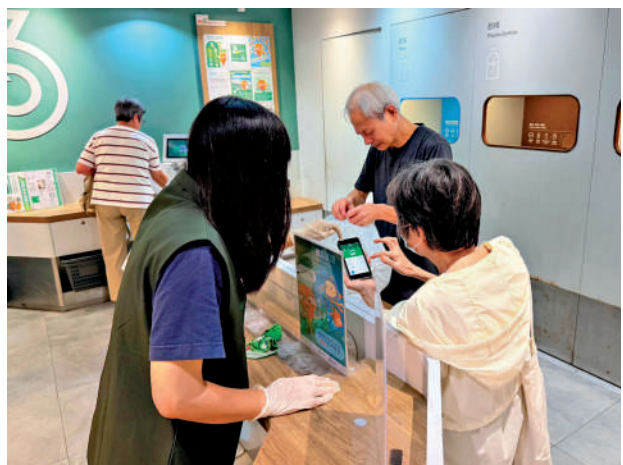
▲南區「綠在香港仔」於2023年5月遷入香港仔街市，以降低租金。