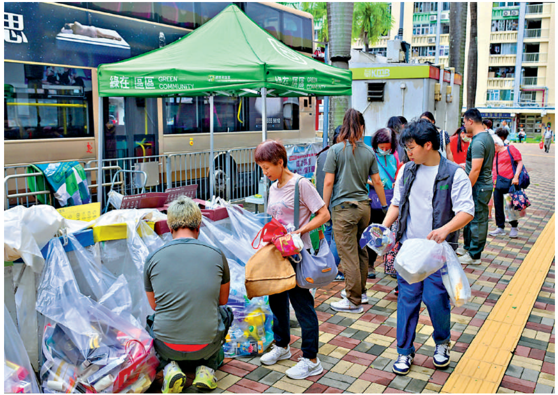
▲特區政府將持續宣傳教育、完善回收網絡等四方向，推動減少都市固體廢物棄置量，目標在2035年達至零廢堆填。