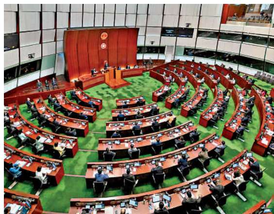
▲立法會昨日首讀《北部都會區發展條例草案》。

五是便利及規管跨境要素流動。賦權行政長官會同行政會議可以就便利及規管跨境要素流動訂立規例，當中包括人員流動、貨物或其他物品（如生物樣本和機器設備）的移動，數據、資料或其他無形物，以及資金的傳送。其中，政府會先為與港深