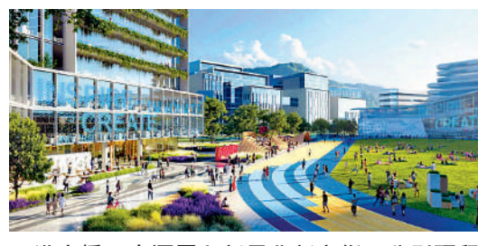
▲洪水橋、牛潭尾和新界北新市鎮已分別預留土地興建大學城。圖為牛潭尾大學城構想圖。

孫東表示，河套聚焦上中游的研發、轉化、中試等，而新田科技城較大規模的土地則為研發成果轉化提供原型、中試和量產空間。政府已在河套預留充足的用地；新田科技城在規劃上亦預留了一定發展彈性，以在後續階段支援未來新興科技產業。至於人才引進，孫東表示，政府有增設河套香港園區申請專窗服務，一站式協助園區租戶及培育公司申請及跟進協助。 大公報記者 楊嘯川