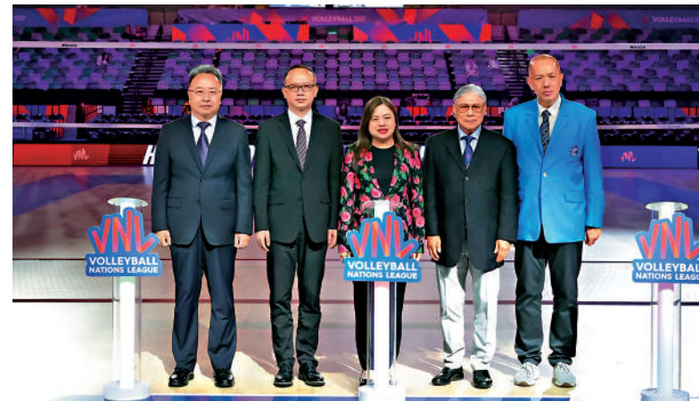
▲開幕式主禮嘉賓合照。

【大公報訊】大公文匯全媒體記者郭正謙報道：「中國人壽（海外）世界女排聯賽香港2026」8日在啟德體藝館開幕。文化體育及旅遊局局長羅淑佩、港協暨奧委會會長霍震霆、中央人民政府駐香港特別行政區聯絡辦公室宣傳文體部副部長林枏、中國香港排球總會會長吳守基，以及中國人壽（海外）總裁劉月進出席啟閉儀式，為賽事揭開序幕。