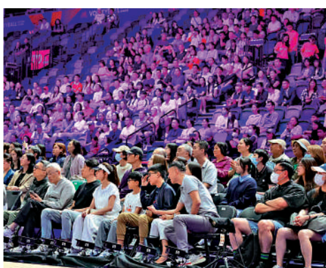
▲球迷聚精會神觀看緊張刺激的賽事。