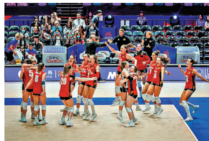
▲比利時球員賽後興奮慶祝取勝。

另一仗，意大利並未受到太大考驗，結果以25：15、23：25、25：10、25：21勝出。