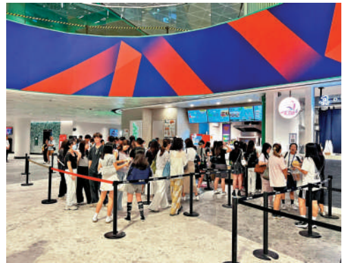
▲球迷在賽事開始前在體藝館內的食店購買食物「醫肚」。