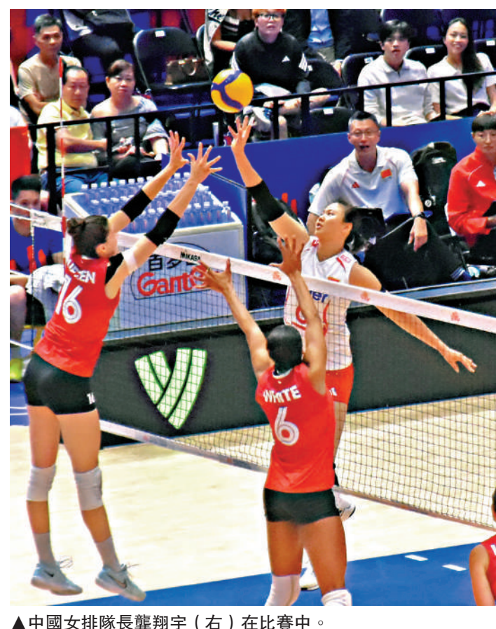
▲中國女排隊長龔翔宇（右）在比賽中。