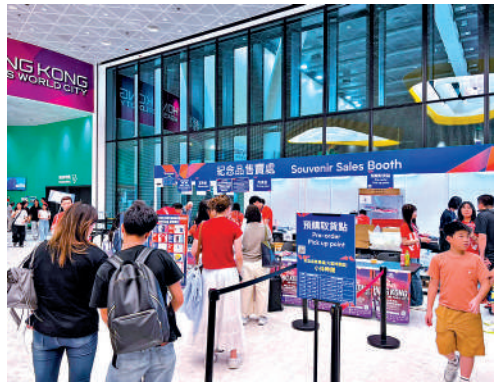
▲不少球迷購買世界女排聯賽的紀念品留念。