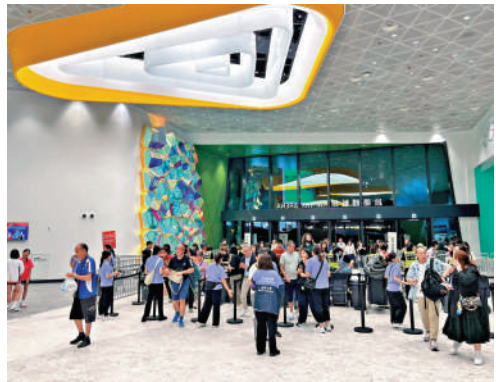
▲世界女排聯賽是本港體育盛事之一，球迷有序入場觀賽。