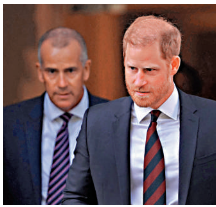
▲英國哈里王子（右）7日在倫敦出席一個基金會活動後離開。法新社

【大公報訊】綜合法新社、美聯社報道：英國高等法院7日裁定，哈里王子等7名原告指控《每日郵報》出版商涉嫌侵犯隱私一案敗訴。法院認定，原告未能證明被告以非法手段竊取私人信息。由於英國實行「敗訴方付費」原則，哈里等人或要承擔5000萬英鎊（約5.2億港元）的巨額法律費用。