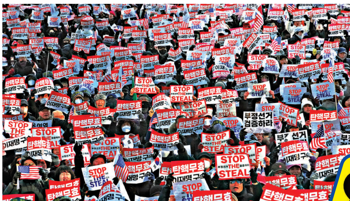
▲2025年1月11日，時任韓國總統尹錫悅的支持者在首爾集會，反對彈劾尹錫悅。

韓國針對網絡虛假信息的《信息通信網法》修訂案於當地時間7日正式生效。根據法案，媒體機構、社交平台及內容創作者散布虛假信息，需承擔最高達實際損失5倍的懲罰性賠償；多次故意散布經法院認定的虛假信息，最高可處以10億韓圓（約520萬港元）罰款。此法案出台背景是韓國近年網絡上虛假信息氾濫，各類陰謀論廣為散播，極右翼勢力長期利用網絡平台煽動民粹主義，持續加劇社會對立。