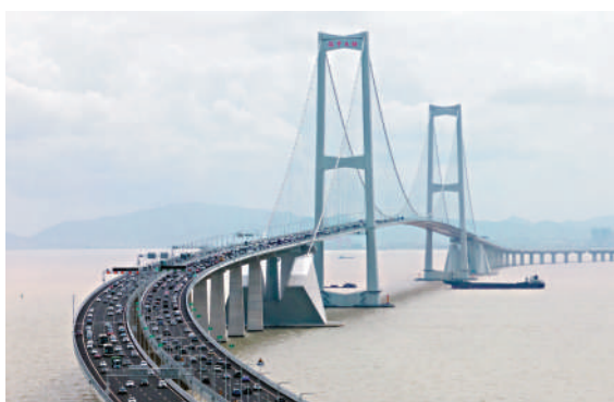
▲深中通道建成通車兩年多來，日均車流量超10萬車次，成為粵港澳大灣區核心交通樞紐。

數據顯示，深中通道海底隧道全長6845米，是目前世界上最長、最寬的鋼殼混凝土沉管隧道。相比港珠澳大橋6車道，其沉管隧道單孔跨度不足15米；深中通道為8車道，單孔跨度超過18米，水下互通區域變寬更接近平24米。為此，深中通道海底隧道未沿用港珠澳大橋海底隧道的鋼筋混凝土沉管方案，而是創新研發超寬深埋鋼殼混凝土沉管管節的「三文治」新結構。相比傳統方案，新結