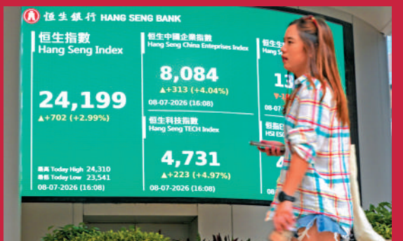
▲恒指昨日最多曾升814點，高見24310點，收市報24199點，升702點。

中國人民銀行行長潘功勝日前表明，將繼續提高在港資產配置比例，加上互聯互通再有優化措施，為香港資本市場發展注入新動能。昨日在AI科技主題估值重構刺激下，港股收報24199點，升702點，北水淨流入更達到141.94億元，較上日增加27.5倍。摩根資產管理亞太區