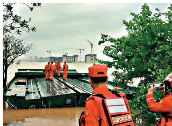
▲7月9日，在廣西貴港市西江教育園區，救援人員使用被稱作「水上救援航母」的動力舟橋轉運被困學生。