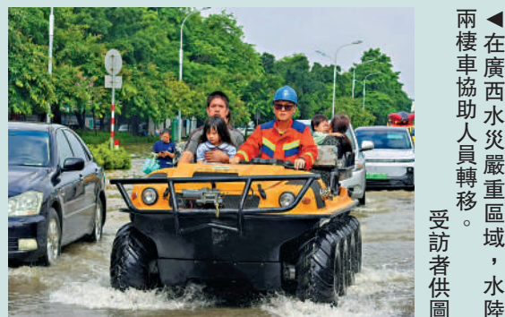
▲在廣西水災嚴重區域，水陸兩棲車協助人員轉移。

靈活補電需求，為手機、筆記本電腦、手電筒等各類移動設備補給電力，提供無噪音的充電環境，可同時為50部手機充電。而「水陸兩棲車」聚焦水災應急人員、物資轉移需求，採用水陸雙驅設計，靈活適配洪澇積水與複雜地形，響應迅速、安全高效。