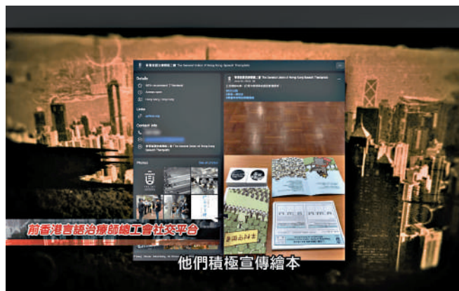
他們積極宣傳繪本

2022年9月10日，5人在受審後被裁定串謀刊印、發布、分發、展示或複製煽動刊物罪罪成，各被判入獄19個月，涉案的3本書籍被定性為煽動刊物。該案件是香港特區成立後首宗串謀發布煽動刊物罪案件。