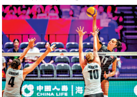
▲加拿大球員米杜維(右)扣球得分。