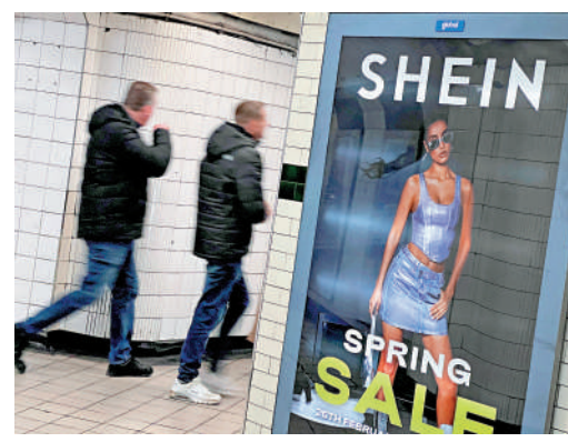
▲希音業務覆蓋160多個國家和地區，以高性價比打入消費市場。

希音業務覆蓋160多個國家和地區，以高性價比打入消費市場。消息指，希音透過提升售價和削減成本，令利潤率上升，預計全年利潤達到20億美元（約156億港元）。胡潤研究院日前發布《2026全球獨角獸榜》，希音以4560億元人民幣的估值位列全球第九。希音的投資者包括IDG Capital、阿布扎比主權財富基金穆巴達拉投資公司（Mubadala Investment）、老虎環球基金（Tiger Global Management）等。外電引述消息指，希音去年曾被股東要求將估值下調至約300億美元（約2340億港元）。