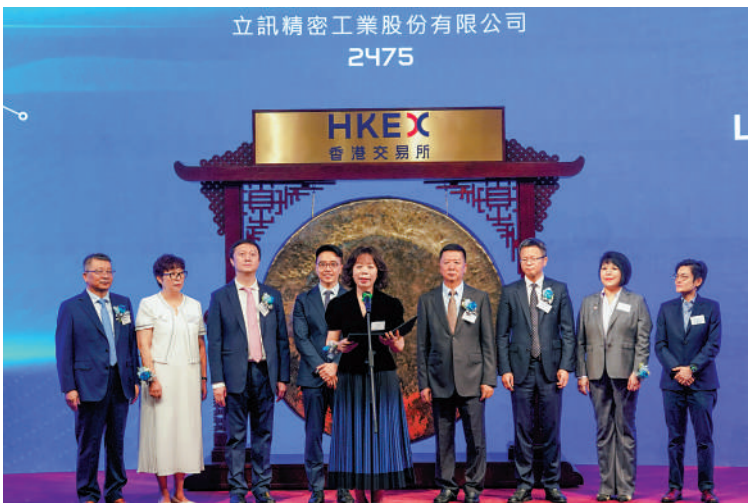
▲A+H股的立訊精密日前在港上市，為今年港股最大的IPO。

就港股市場上半年出現K型走勢，AI相關股份大升，同期恒指下跌，王亞軍直言，主要指數不能代表香港市場面貌。港股兩大指數成份股更新周期漫長，不能體現市場進入AI時代的現況，導致指數疲弱，而新股、AI股普漲的背離行情。