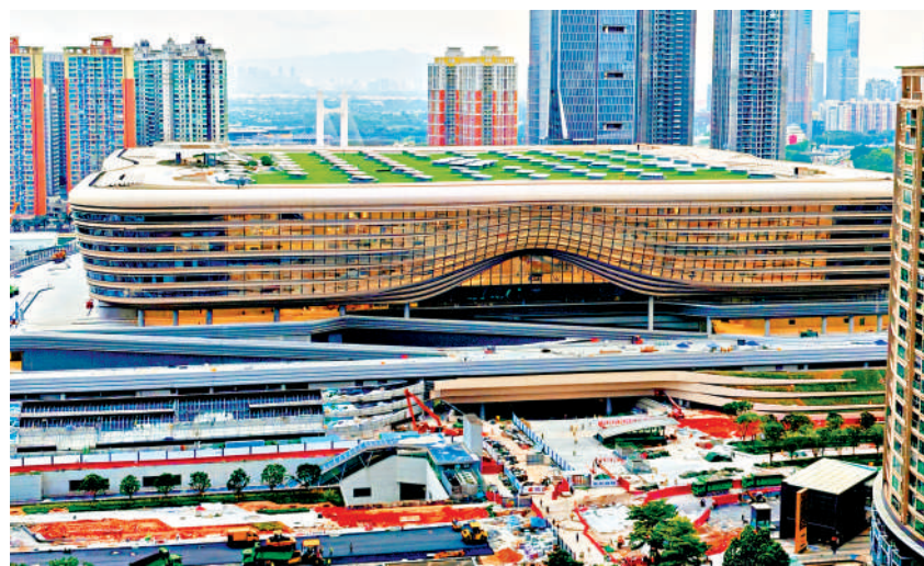
國家移民管理局10日表示，將利用新皇崗口岸建設契機，拓展「人臉+虹膜」智能通關等應用場景。圖為新皇崗口岸聯檢大樓。