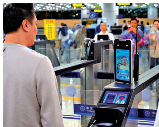
今年上半年，羅湖、皇崗等19個口岸全面推行旅客「刷臉」智能通關，人均用時縮短至10秒。