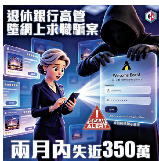
守網者市專頁發圖警惕市民，慎防網上招聘騙案。