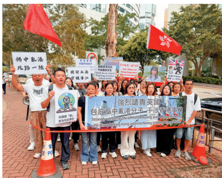
多批市民自發赴英領館抗議。