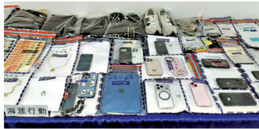
▲警方搗破虛假投資App詐騙集團，檢獲大批證物。

值成功。警方相信，已瓦解該個詐騙集團，不排除有更多人被捕。警方呼籲市民，如果曾經下載或使用「FactorOne」投資應用程式，或曾經到相關商場舖位進行所謂現金充值，或懷疑自己曾經向該集團提供款項，盡快聯絡警方。