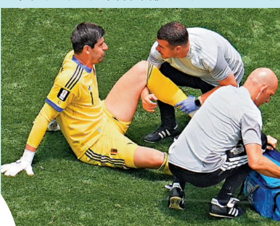
▲高圖爾斯(左一)接受隊醫治理。