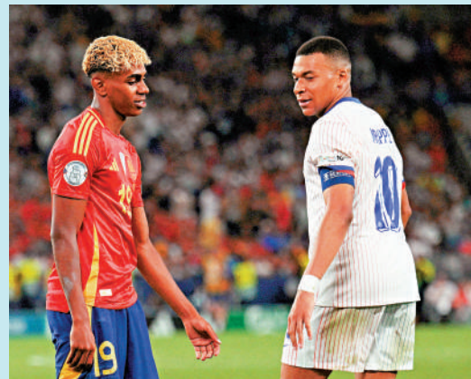
▲耶馬(左)在2025年歐國盃4強比賽中，曾與麥巴比(右)交手。資料圖片