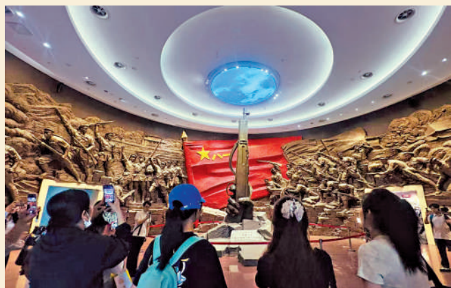
▲學子們參觀南昌市八一一起義紀念館。

「2026范長江行動——香港傳媒學子江西行」由香港大公文匯傳媒集團、江西省委宣傳部主辦，採訪團成員來自贛港多所高校。6月22日至29日，港贛學子們從「英雄城」南昌出發，沿長江最美岸線而行，抵達千年瓷都景德鎮，其間探訪革命舊址、產業園區、歷史遺存，在紅色傳承、綠水青山和悠遠文脈交織的贛鄱大地上行走、採攝、體悟，讀懂真實立體而豐富的新時代江西的同時，收穫真摯友誼。