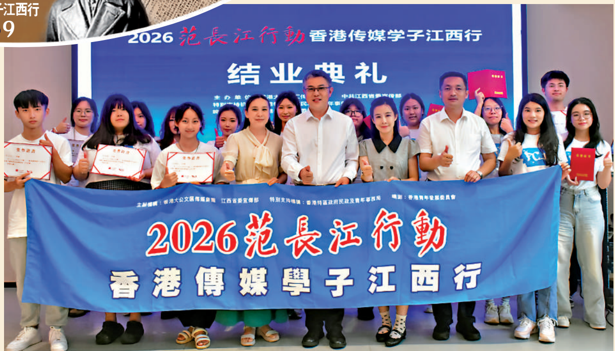
▲「2026范長江行動——香港傳媒學子江西行」在千年瓷都舉行結業儀式，與會嘉賓合影。