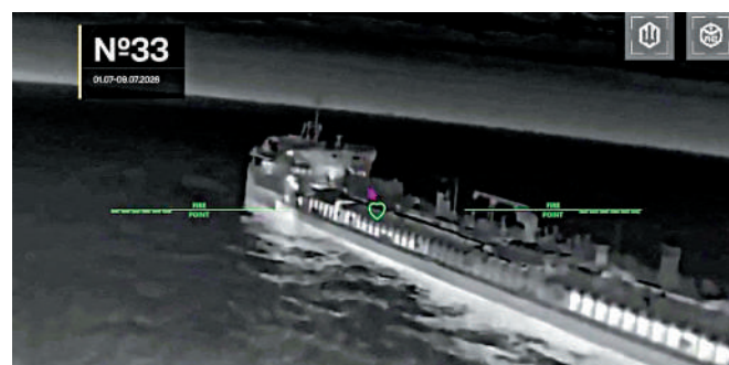
▲烏軍無人機在亞速海襲擊了一艘俄羅斯油輪。路透社

轉戰局尚為時過早。路透社指出，俄方近來透過加強轟炸基輔等城市作為報復，凸顯烏克蘭在面對彈道導彈襲擊時的脆弱性。