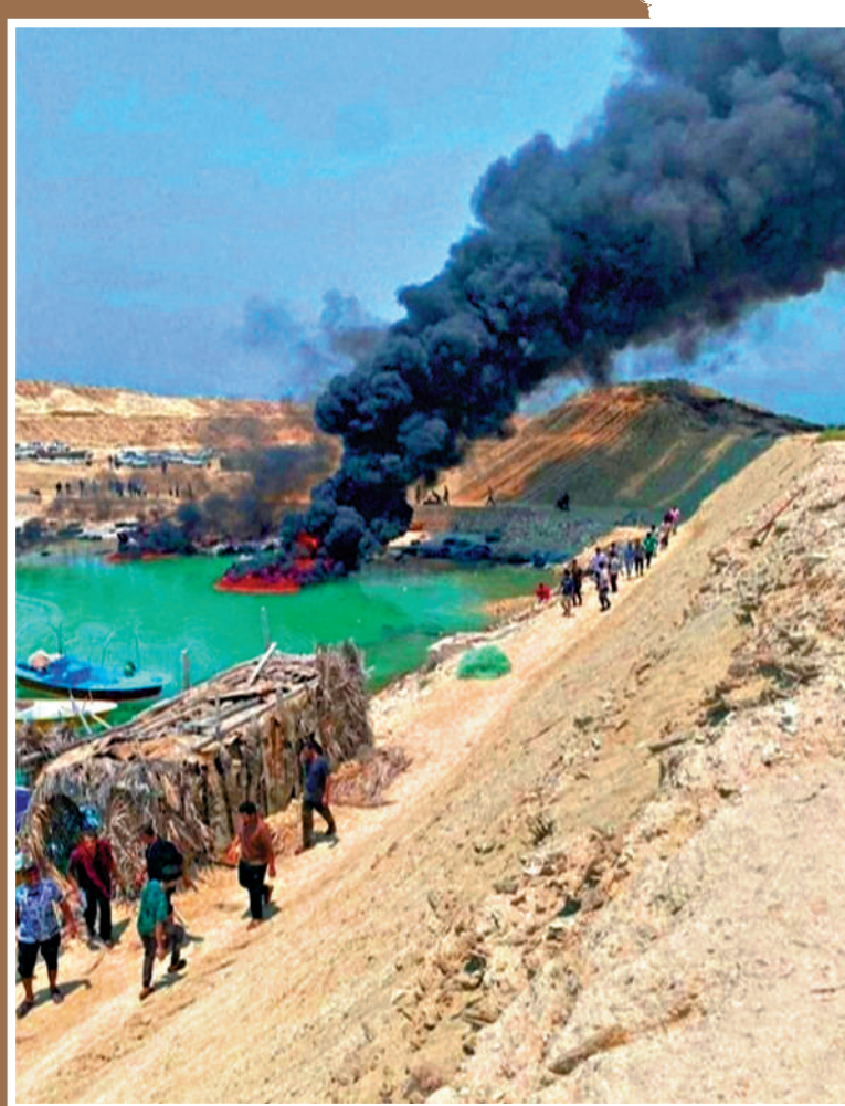
▲美軍9日襲擊了伊朗布什爾省巴努德碼頭，現場濃煙滾滾。