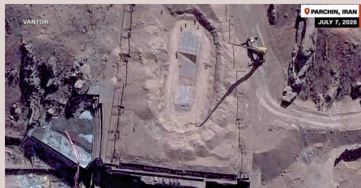
▲美媒稱伊朗帕爾欽軍事基地內觀測到施工活動。

美媒此前披露，美國軍方5月曾制定一項高風險行動方案，計劃派遣地面部隊進入伊朗，強行奪取其高濃縮鈾庫存，並已將相關方案上報美國總統特朗普審議。但在評估此舉可能引發伊朗強烈報復、導致戰爭全面升級以及造成大量美軍傷亡後，特朗普最終叫停了這一計劃。