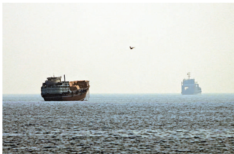
▲9日，通過霍爾木茲海峽區域的船隻數量降至22艘。

歐洲各國雖被迫接受航運成本抬升的現實，但同時向伊朗和阿曼施壓，要求收費機制不得依據船隻國籍實施差別化對待。英國和法國還提議組建國際海上掃雷聯軍，清理海峽水下水雷；但聯軍能否部署，取決於永久和平協議談判推進進度。