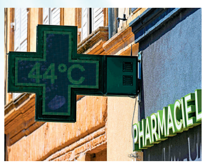
▲「熱穹頂」效應下，歐洲部分地區溫度高達44°C。

在不少歐洲政客操弄「產能過剩」議題時，許多歐洲網民在社交媒體上點讚「中國製造」：「中國空調免安裝，便宜又好用，歐洲應該多進口。」