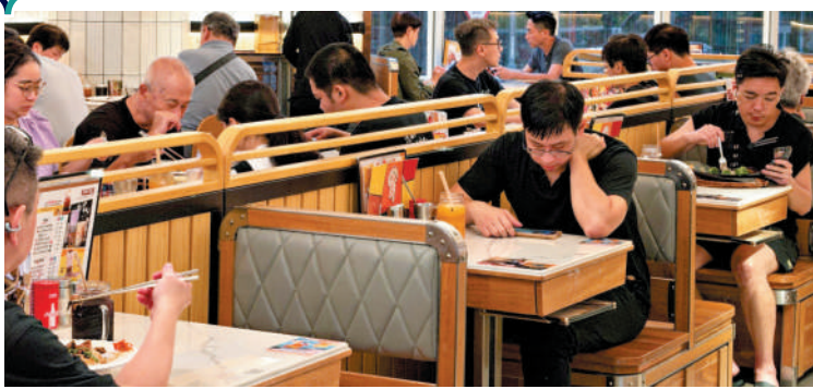
多間狗隻友善食肆「退牌」