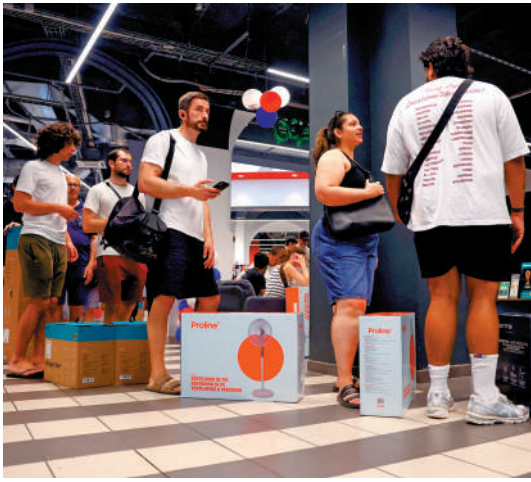
▲風扇和加濕器等降溫產品在歐洲銷量急升。

幾年前，美的位於德國斯圖加特的歐洲研發中心捕捉到此一商機，於是調動中國、德國、意大利三地研發團隊，歷時三年打磨最終