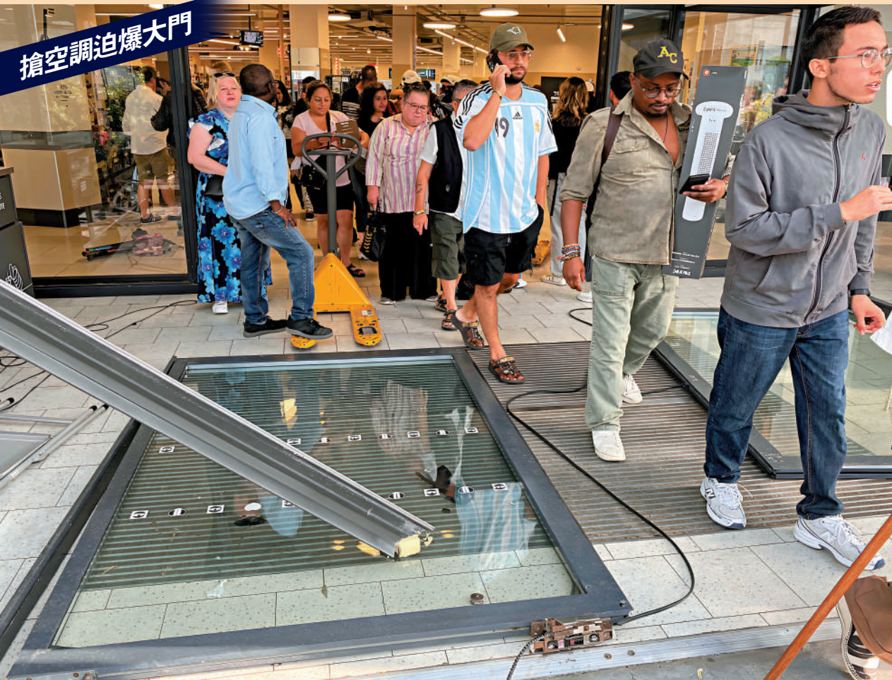
▲法國東部城市貝桑松一間超市日前舉行空調特賣活動，民衆爭相湧入店內搶購貨品「迫爆」大門。