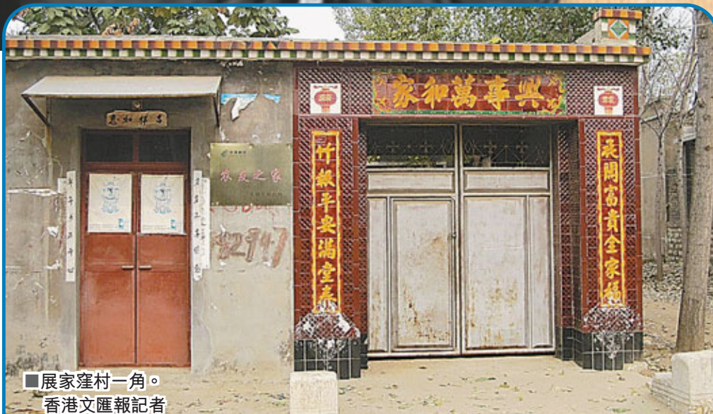
■展家窪村一角。