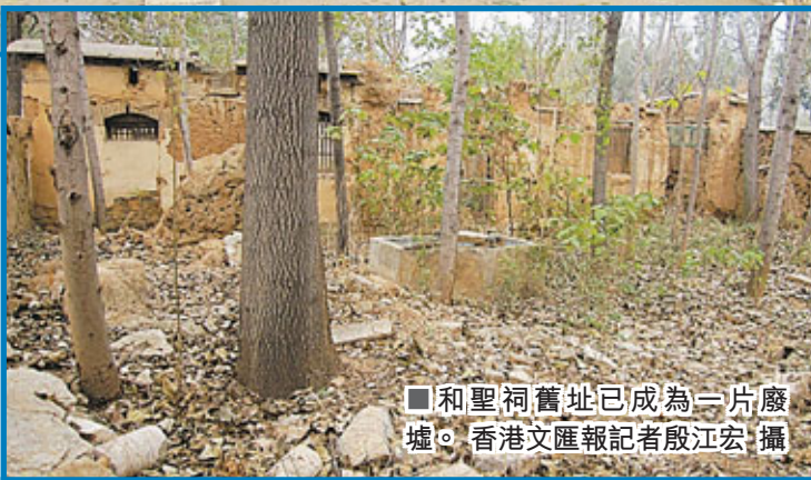
■和聖祠舊址已成為一片廢墟。