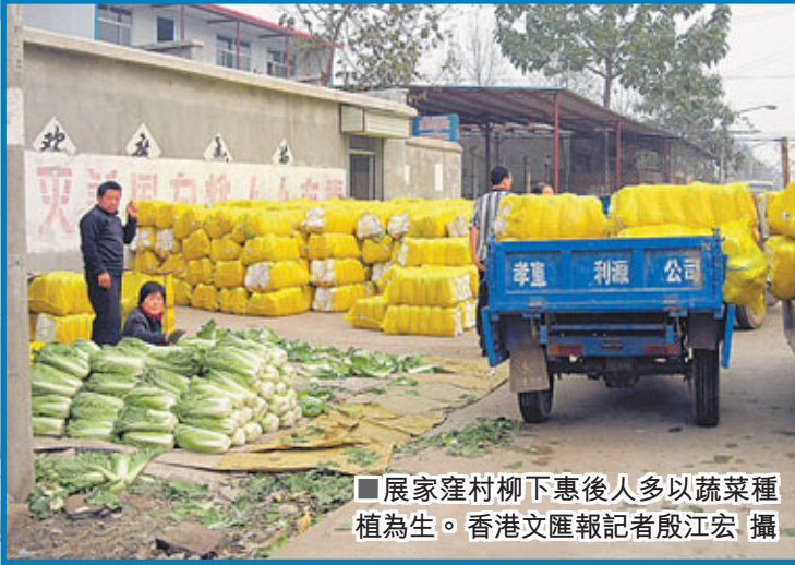
■展家窪村柳下惠後人多以蔬菜種植為生。