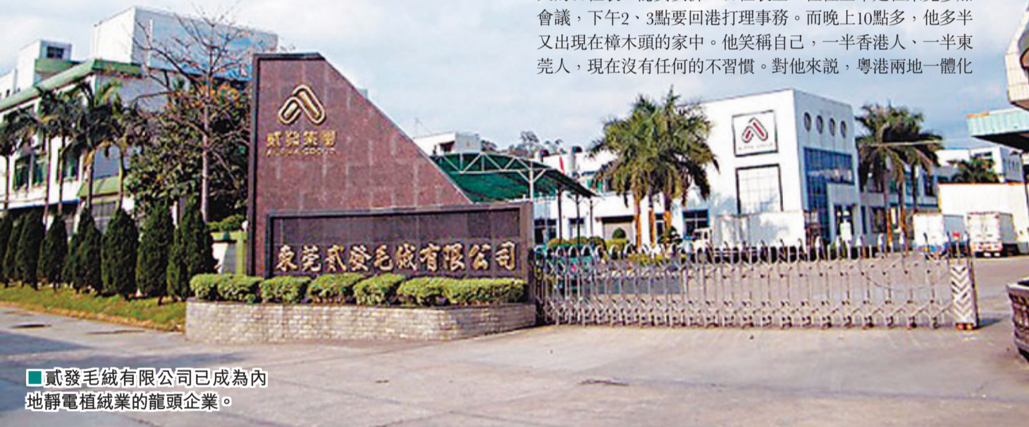
■貳發毛絨有限公司已成為內地靜電植絨業的龍頭企業。