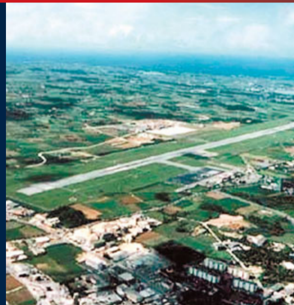
美軍飛機昨天第一次降落在宮古島機場，令島民極之不滿。網上圖片