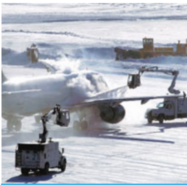
明尼阿波利斯 飛機去雪