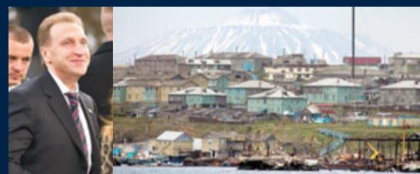
舒瓦洛夫周一視察南千島群島。資料圖片

據路透社報導，俄羅斯第一副總理舒瓦洛夫周一視察了同日本有主權爭議的南千島群島(日稱「北方四島」)。日本首相菅直人對舒瓦洛夫登島之行表示「非常遺憾」，日本政府官員向俄羅斯駐東京大使傳達日