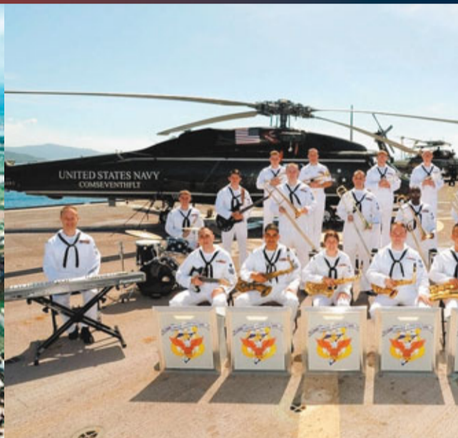
美軍第7艦隊的一支樂團昨抵達宮古島，邀請800名島民出席演唱會，聲稱要慰問島民。網上圖片