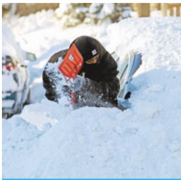
明尼阿波利斯 汽車全埋