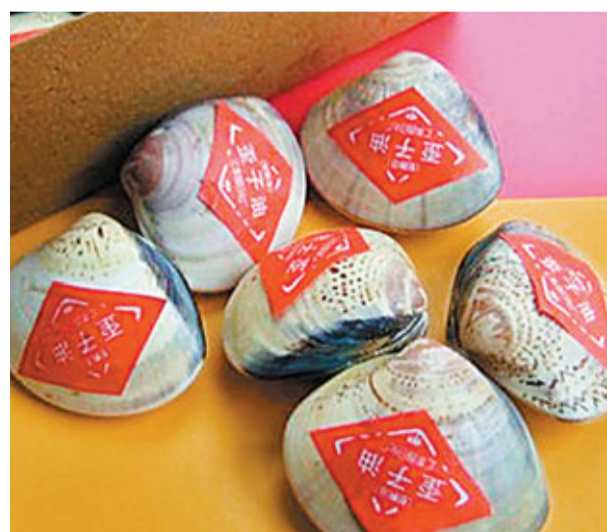
懷舊的蛤蚧油。

我小的時候還有一種蛤蚧油，用雞蛋大小的蚌殼作為包裝，內裝不知用何種原料調配成的固體油脂，售價非常便宜。每到冬天，大人就會為家裡的孩子一人買一個，揣在兜裡帶着上學校，感到臉上乾澀了就掏出來塗一塗，是很大眾化的潤膚品。如今想起來，還能依稀記得那已經久違了的、幾乎陌生的香味。